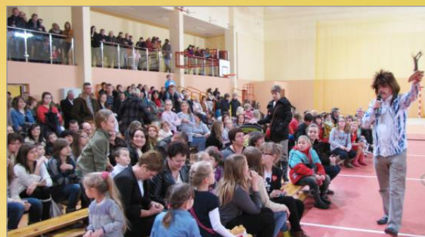
Wielka Orkiestra Świątecznej Pomocy w Witkowie strona 2