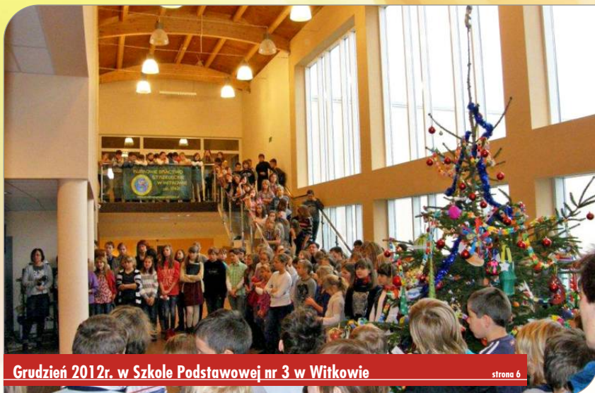
Grudzień 2012r. w Szkole Podstawowej nr 3 w Witkowie