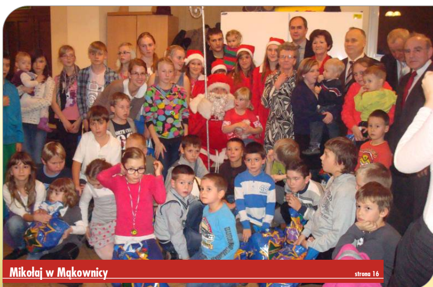
Mikołaj w Mąkownicy