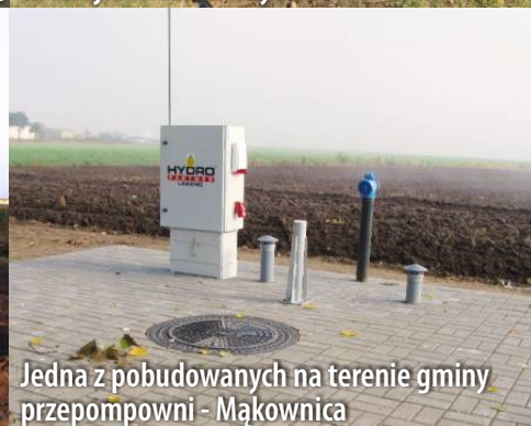
Jedna z pobudowanych na terenie gminy przepompowni - Mąkownica