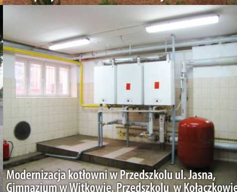
Modernizacja kotłowni w Przedszkolu ul. Jasna, Gimnazjum w Witkowie, Przedszkolu w Kołaczkowie