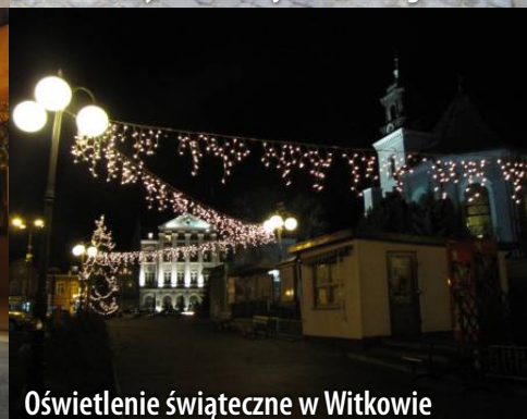
Oświetlenie świąteczne w Witkowie