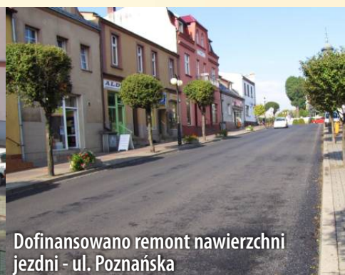
Dofinansowano remont nawierzchni jezdni - ul. Poznańska