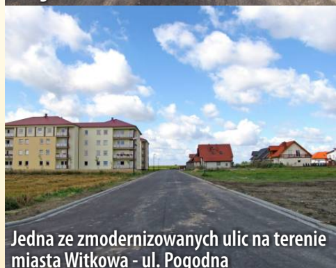
Jedna ze zmodernizowanych ulic na terenie miasta Witkowa - ul. Pogodna