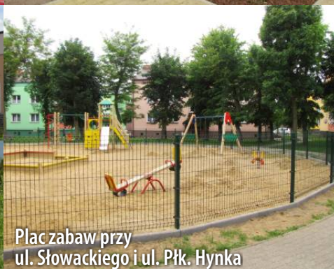
Plac zabaw przy ul. Słowackiego i ul. Płk. Hynka