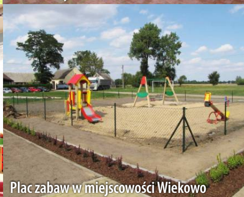
Plac zabaw w miejscowości Wiekowo