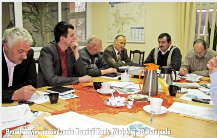
Przedsesyjne posiedzenia Komisji Rady Miejskiej 28 listopada