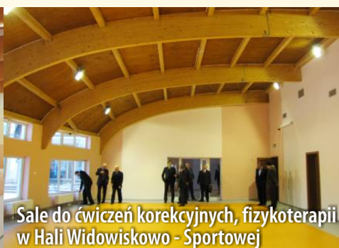
Sale do ćwiczeń korekcyjnych, fizykoterapii w Hali Widowiskowo - Sportowej