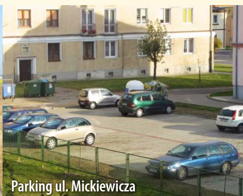
Parking ul. Mickiewicza