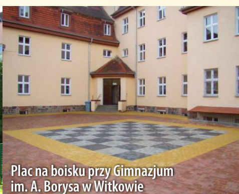
Plac na boisku przy Gimnazjum im. A. Borysa w Witkowie