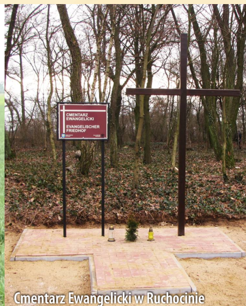
Cmentarz Ewangelicki w Ruchocinie