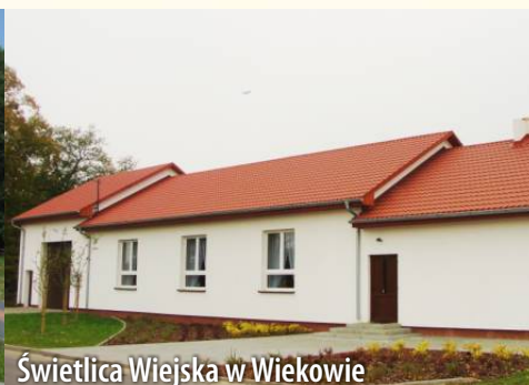
Świetlica Wiejska w Wiekowie