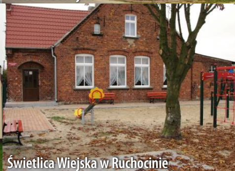
Świetlica Wiejska w Ruchocinie