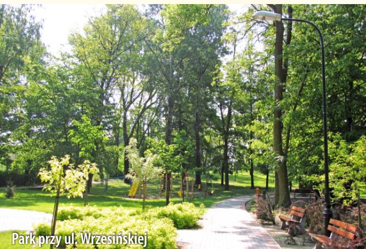
Park przy ul. Wrzesińskiej