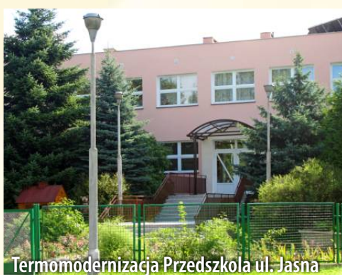
Termomodernizacja Przedszkola ul. Jasna