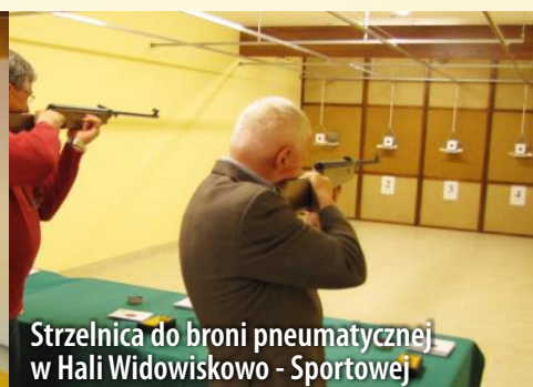
Strzelnica do broni pneumatycznej w Hali Widowiskowo - Sportowej