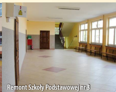
Remont Szkoły Podstawowej nr 3