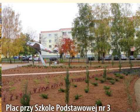
Plac przy Szkole Podstawowej nr 3