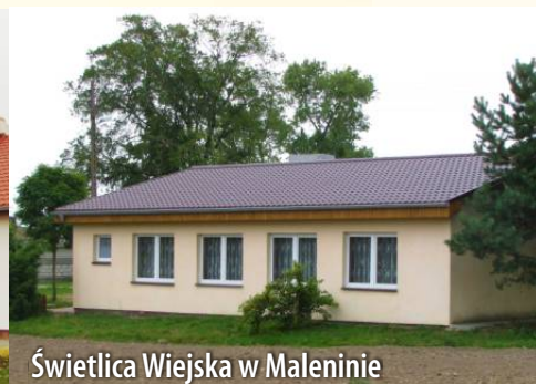
Świetlica Wiejska w Maleninie