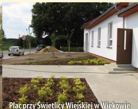
Plac przy Świątyni Wiejskiej w Wiekowie