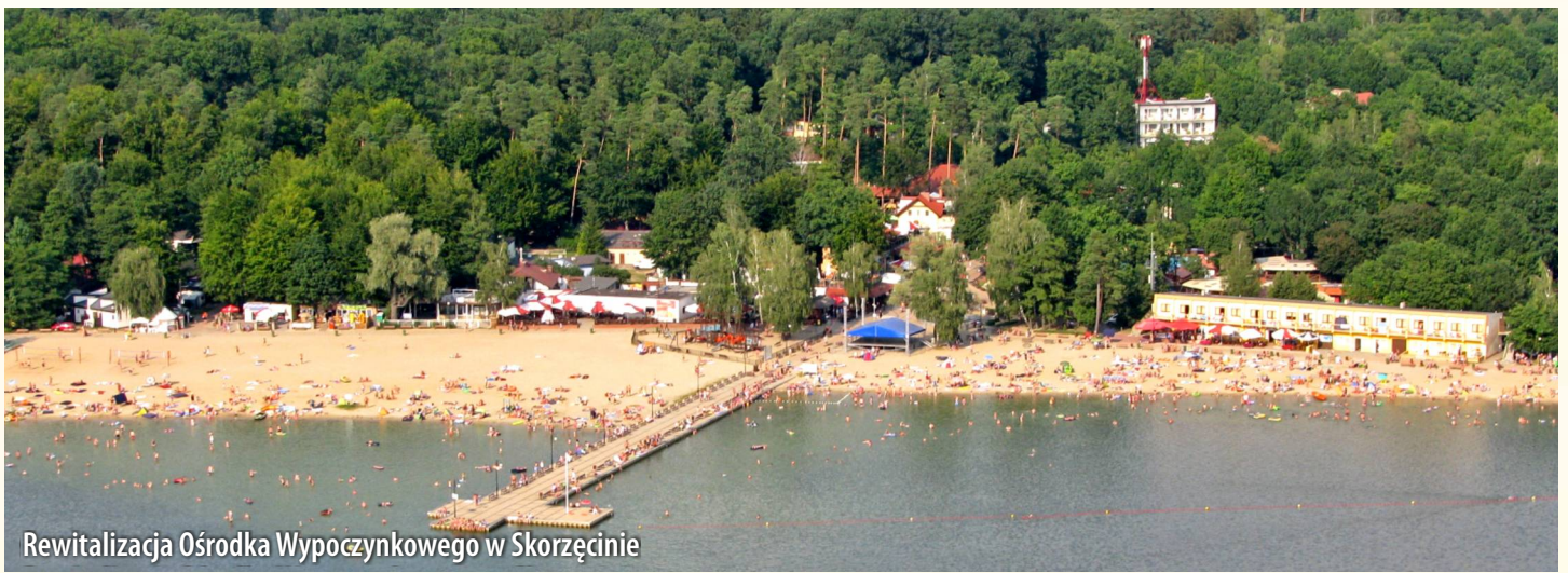
Rewitalizacja Ośrodka Wypoczynkowego w Skorzęcinie