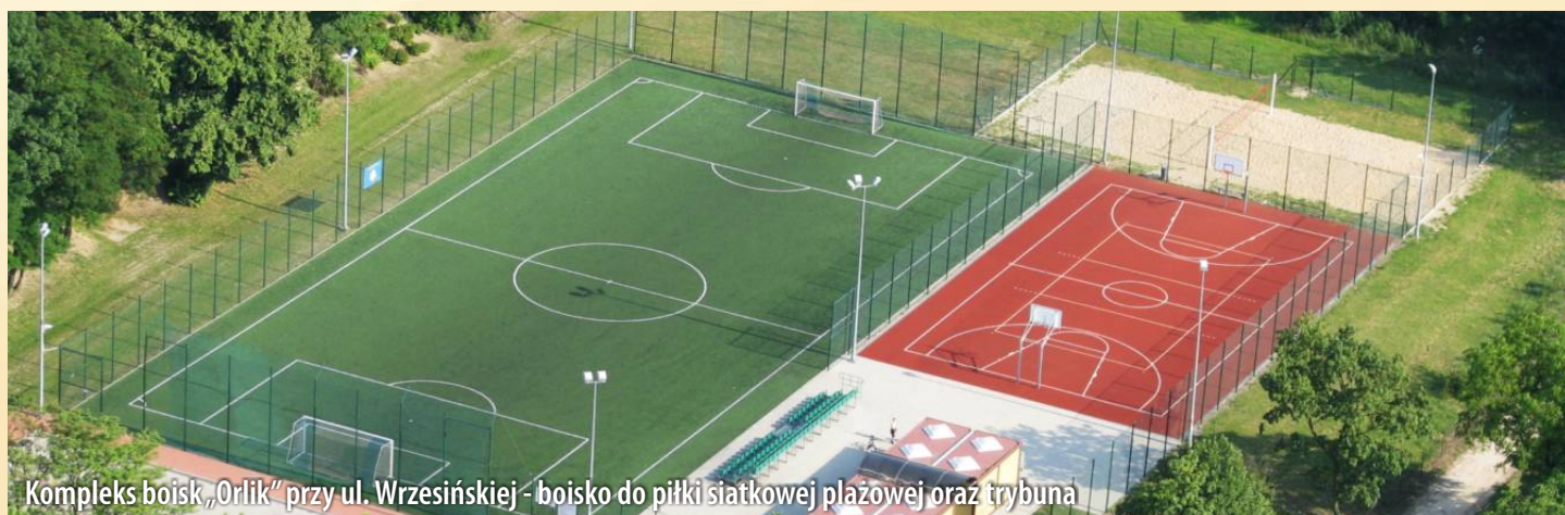
Kompleks boisk „Orlik” przy ul. Wrzesińskiej - boisko do piłki siatkowej plażowej oraz trybuna