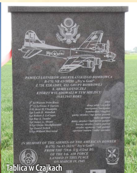
Tablica w Czajkach