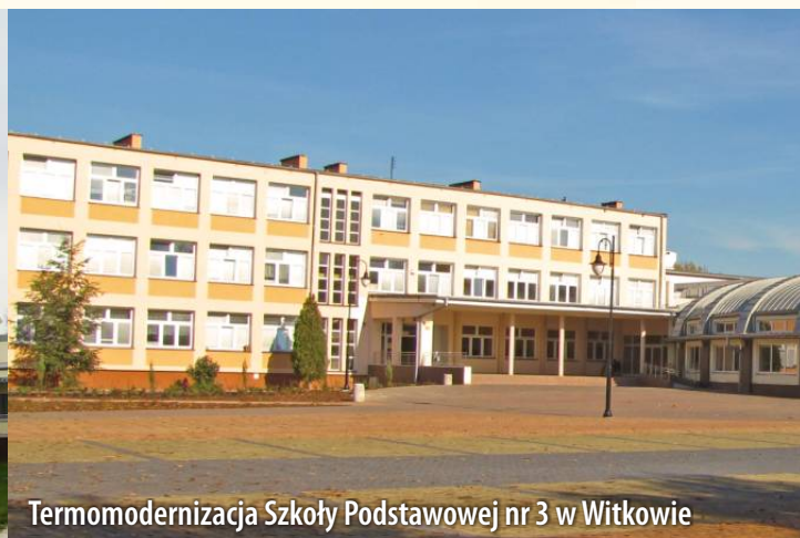
Termomodernizacja Szkoły Podstawowej nr 3 w Witkowie