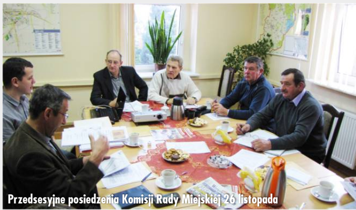
Przedsesyjne posiedzenia Komisji Rady Miejskiej 26 listopada

W dniu 14 listopada br. odbyło się kolejne posiedzenie Komisji Rewizyjnej. Komisja dokonała kontroli sposobu rozpatrywania skarg wpływających do Urzędu Gminy i Miasta oraz kontroli Modelarni.