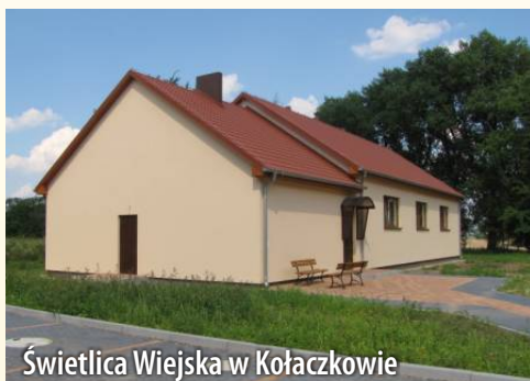
Świetlica Wiejska w Kończowie

Przykłady inwestycji realizowanych w latach 2010-2012 na terenie Gminy i Miasta Witkowo