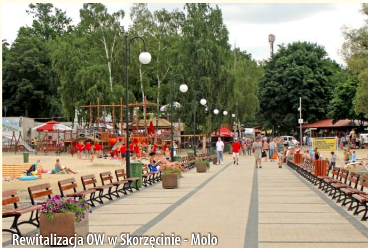
Rewitalizacja OW w Skorzęcinie - Molo