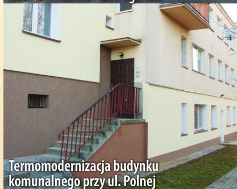
Termomodernizacja budynku komunalnego przy ul. Polnej