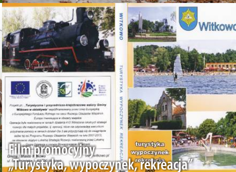
Film promocyjny „Turystyka, wypoczynek, rekreacja”