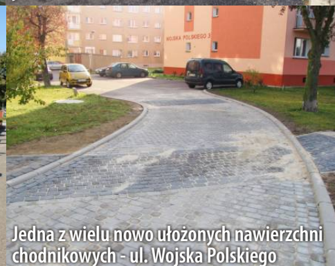
Jedna z wielu nowo ułożonych nawierzchni chodnikowych - ul. Wojska Polskiego