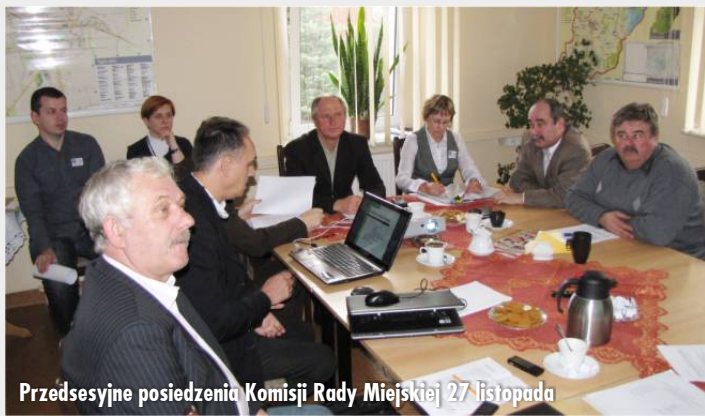
Przedsesyjne posiedzenia Komisji Rady Miejskiej 27 listopada

i opłat lokalnych. Zgodnie z procedurą uchwalania budżetu, na przedsesyjnych posiedzeniach Komisja Rolnictwa i Komisja Oświaty zaopiniowały projekt budżetu gminy i miasta na 2013r.