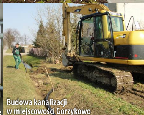
Budowa kanalizacji w miejscowości Gorzykowo