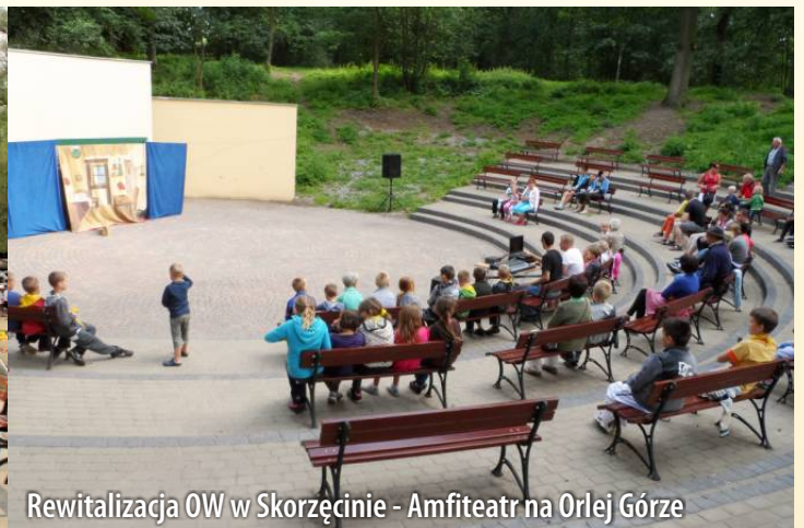
Rewitalizacja OW w Skorzęcinie - Amfiteatr na Orlej Górze