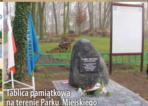
Tablica pamiątkowa na terenie Parku Miejskiego