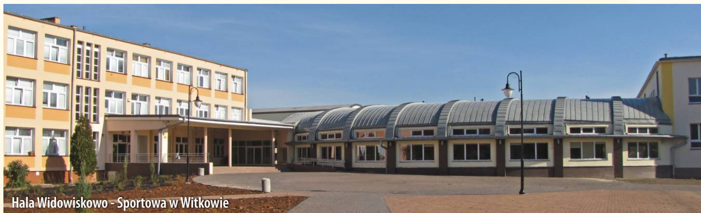
Hala Widowiskowo - Sportowa w Witkowie

Przykłady inwestycji realizowanych w latach 2010-2012 na terenie Gminy i Miasta Witkowo