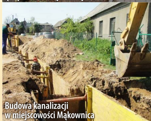
Budowa kanalizacji w miejscowości Mąkownica