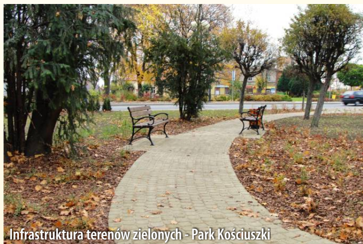
Infrastruktura terenów zielonych - Park Kościuszki

Przykłady inwestycji realizowanych w latach 2010-2012 na terenie Gminy i Miasta Witkowo