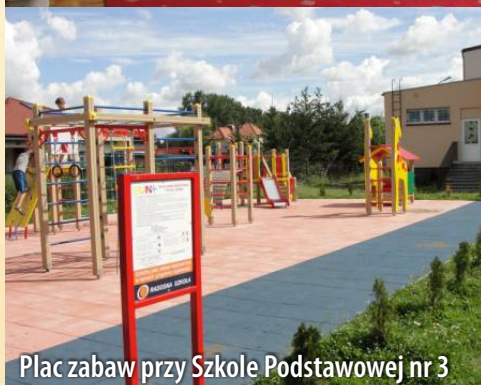
Plac zabaw przy Szkole Podstawowej nr 3