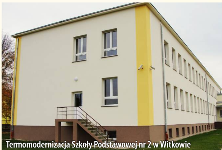
Termomodernizacja Szkoły Podstawowej nr 2 w Witkowie

Przykłady inwestycji realizowanych w latach 2010-2012 na terenie Gminy i Miasta Witkowo