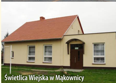
Świetlica Wiejska w Mąkownicy