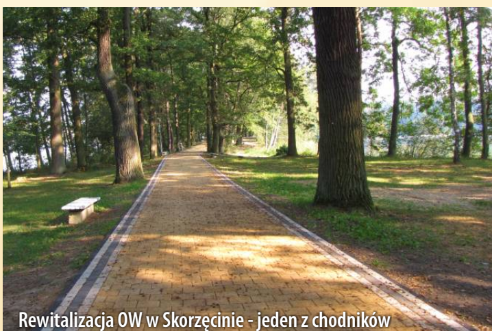
Rewitalizacja OW w Skorzęcinie - jeden z chodników