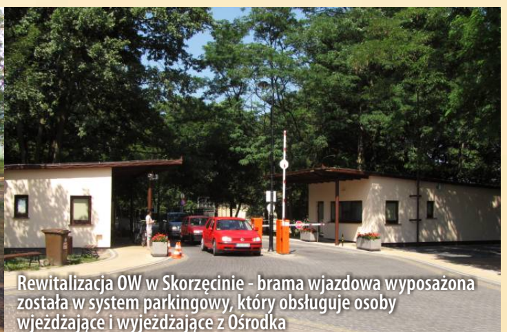
Rewitalizacja OW w Skorzęcinie - brama wjazdowa wyposażona została w system parkingowy, który obsługuje osoby wjeżdżające i wyjeżdżające z Ośrodka