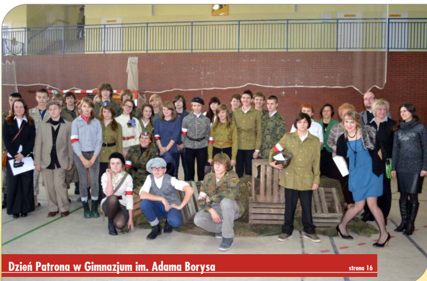
Dzień Patrona w Gimnazjum im. Adama Borysa