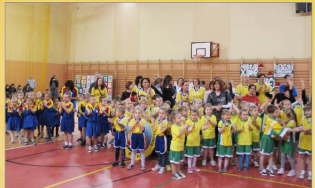
X Mikolajkowy Turniej Przedszkoli i Oddziałów Przedszkolnych