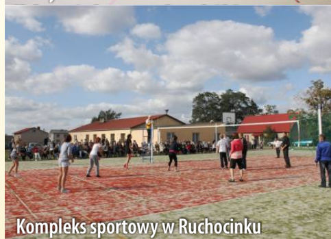
Kompleks sportowy w Ruhocinku