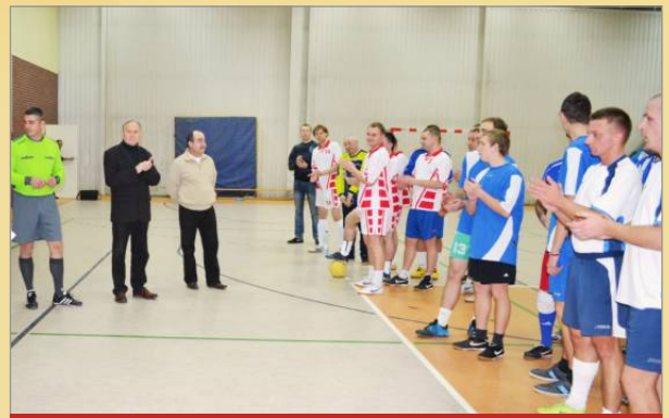
X Mistrzostwa Gminy Witkowo w Halowej Piłce Nożnej