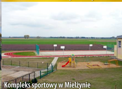
Kompleks sportowy w Mielżynie