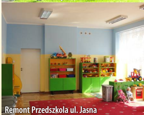
Remont Przedszkola ul. Jasna