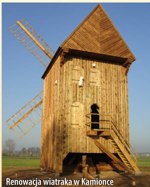
Renowacja wiatraka w Kamionce