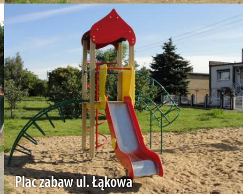
Plac zabaw ul. Łąkowa