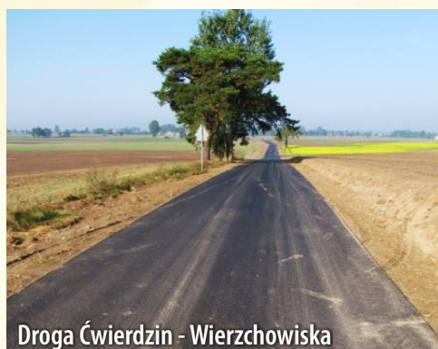
Droga Ćwierdzin - Wierzchowiska