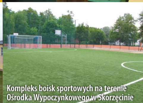
Kompleks boisk sportowych na terenie Ośrodka Wypoczynkowego w Skorzęcinie