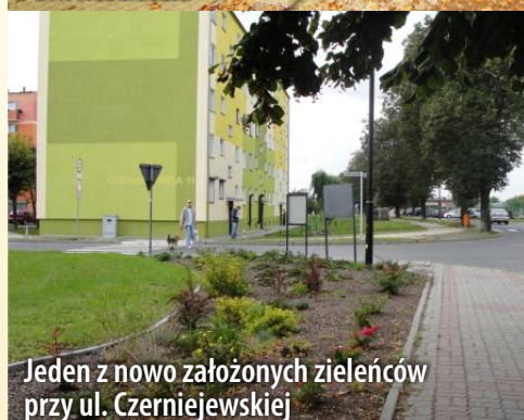
Jeden z nowo założonych zielenców przy ul. Czarniejewskiej