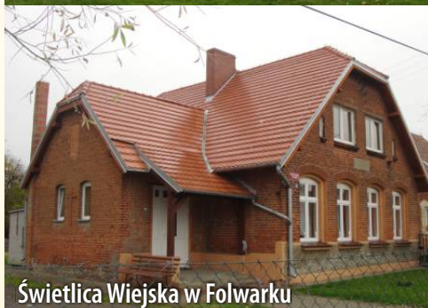
Świetlica Wiejska w Folwarku