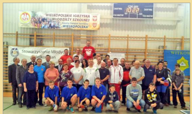
Sołtysi popularyzują tenis stołowy