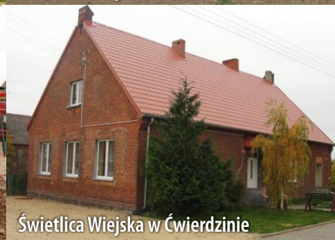
Świetlica Wiejska w Czwierdzinie