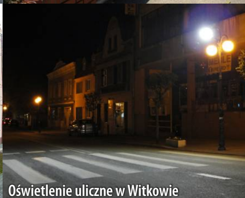
Oświetlenie uliczne w Witkowie