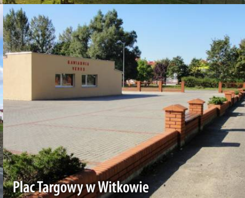
Plac Targowy w Witkowie