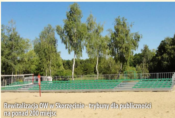
Rewitalizacja OW w Skorzęcinie - trybuny dla publiczności na ponad 200 miejsc