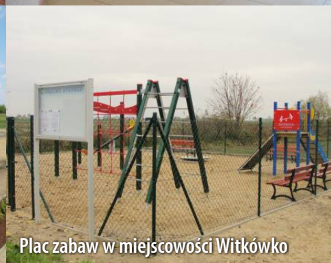
Plac zabaw w miejscowości Witkówko