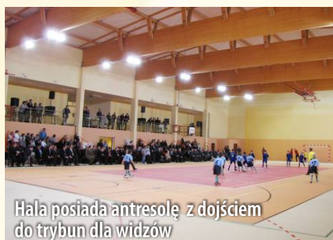
Hala posiada antresole z dojściem do trybun dla widzów