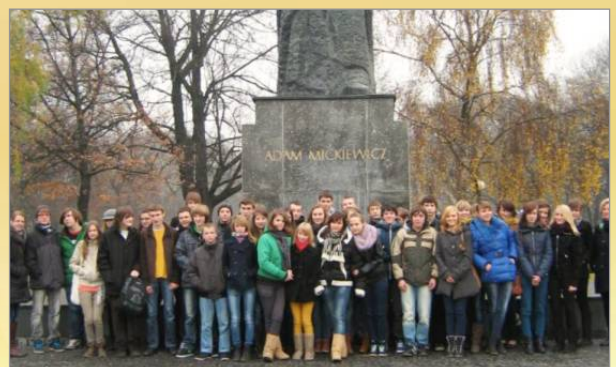
Wyjazd młodzieży z Gimnazjum im. A. Borysa w Witkowie do Uniwersytetu im. Adama Mickiewicza w Poznaniu