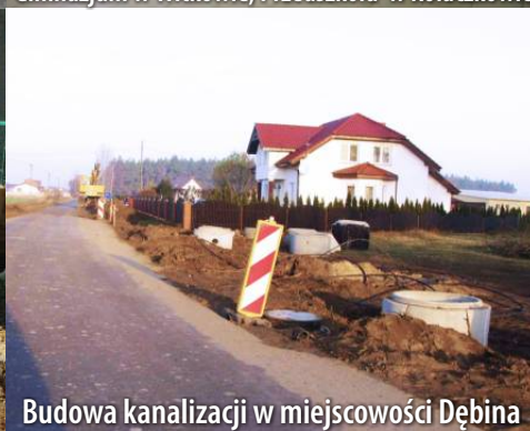
Budowa kanalizacji w miejscowości Dębina