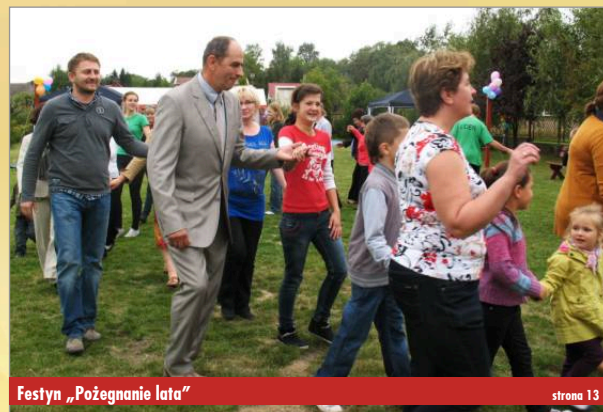
Festyn „Pożegnanie lata”