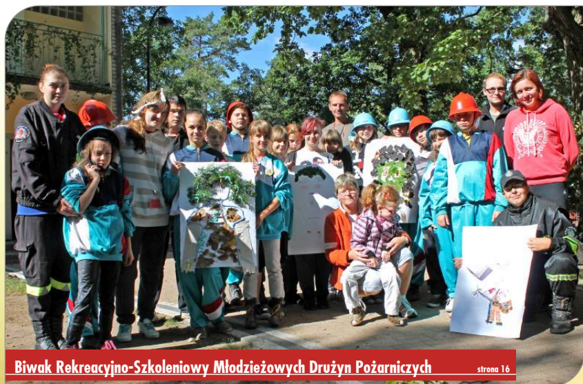
Biwak Rekreacyjno-Szkoleniowy Młodzieżowych Drużyn Pożarniczych