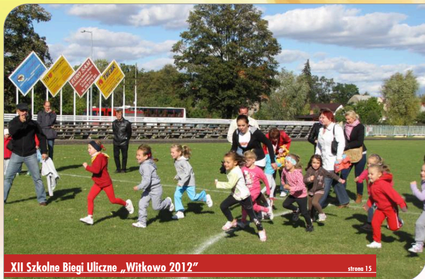
XII Szkolne Biegi Uliczne „Witkowo 2012”