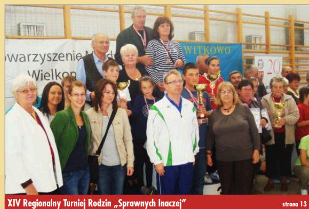
XIV Regionalny Turniej Rodzin „Sprawnych Inaczej”