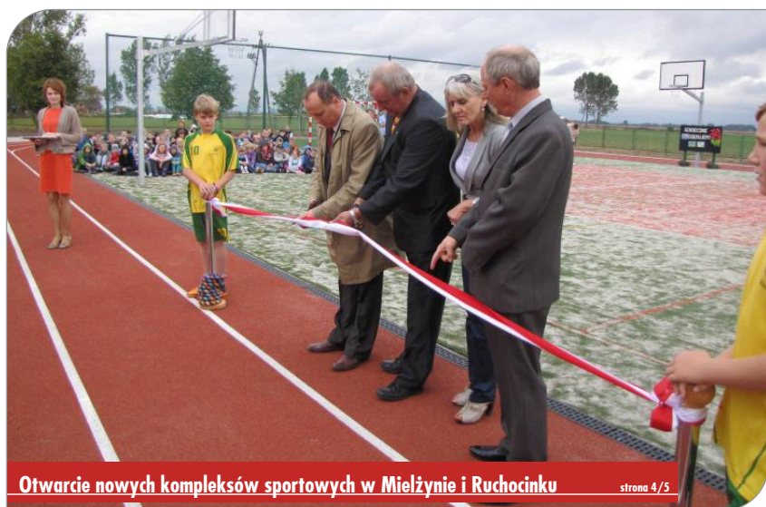
Otwarcie nowych kompleksów sportowych w Mielzynie i Ruchocinku