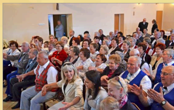
Spotkanie chórów w Mielzynie