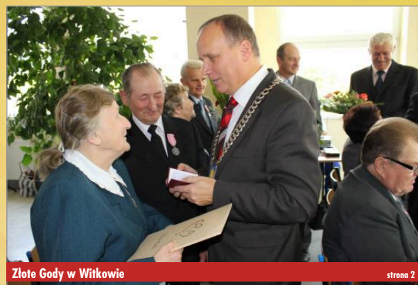
Złote Gody w Witkowie