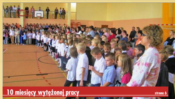
10 miesięcy wyteżonej pracy