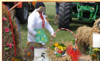
Ruchocin III miejsce