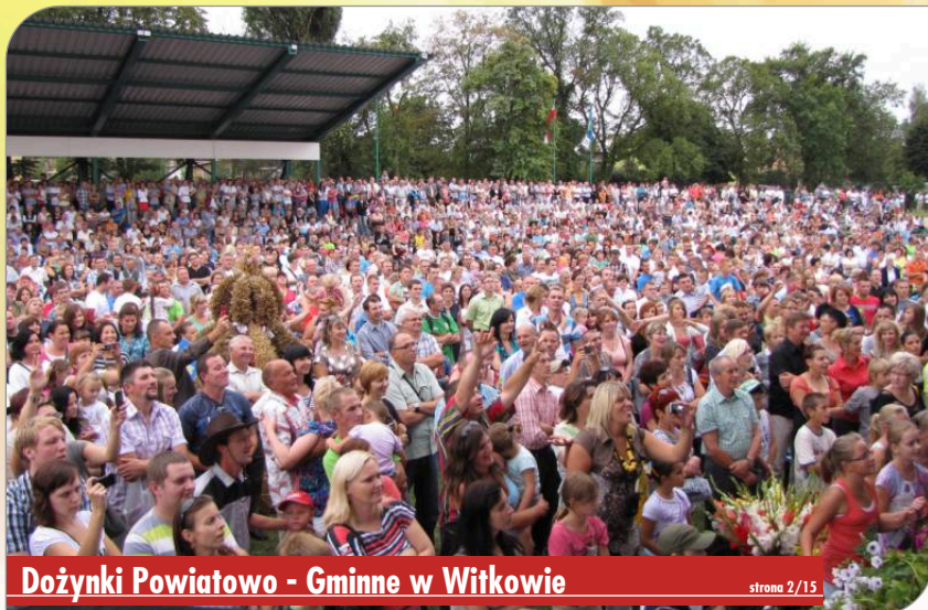
Dożynki Powiatowo - Gminne w Witkowie