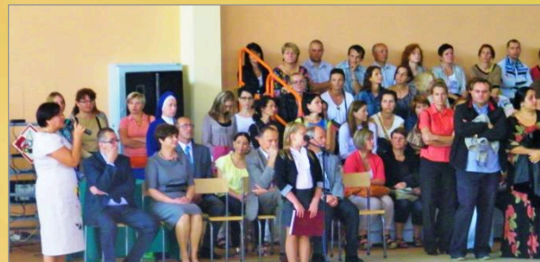
Rozpoczęcie roku szkolnego 2012/2013 w SP3