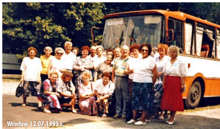
Wrocław 12.07.1995 r.

Istotnym elementem w działalności naszego Związku jest integrowanie środowiska naszych członków z osobami, które nie są członkami.