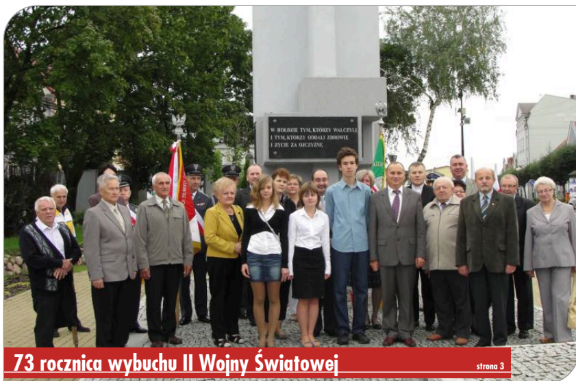
73 rocznica wybuchu II Wojny Światowej