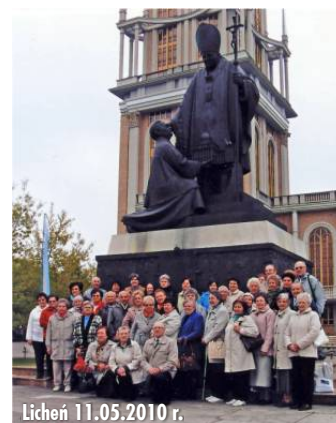
Lichen 11.05.2010 r.

wielkiego dzwonu. Ze względu na bliską odległość do Lichenia wyjazdy organizowane są tak często, jak tylko są chętni. Przy okazji wycieczek w różne regiony Polski odwiedziliśmy także inne znane Sanktuaria Maryjne. W 1998r. i 2000r. odwiedziliśmy Jasną Górę, a także Kalwarię Zebrzydowską - w 1998r. w czasie zorganizowanego wyjazdu do Krakowa. Odwiedziliśmy także klasztor w Łądzie w 1998r. gdzie, co roku wystawiane jest Misterium Męki Pańskiej. Tymi wyjazdami w miejsca duchowej odnowy realizujemy słowa ewangelisty „Si Deus nobiscum quis contra nos - Jeśli Bóg z nami, kto przeciw nam”. Ważną działalnością w naszej organizacji jest poznawanie dorobku kulturalnego naszych poprzedników, którzy tworzyli przez wiele wieków wielkie dzieła, które teraz możemy podziwiać, co przynosi chlubę