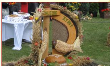
Małachowo Złych Miejsk I miejsce