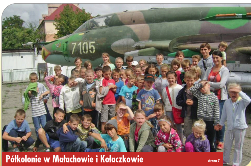
Półkolonie w Małachowie i Kołaczkwie