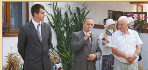
Dożynki sołeckie w Małachowie Złych Miejsc