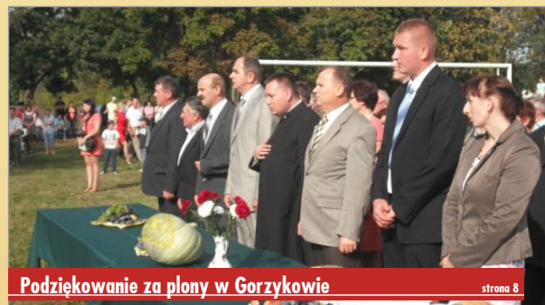
Podziękowanie za plony w Gorzykowie