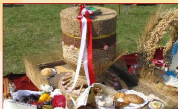
Gorzykowo II miejsce