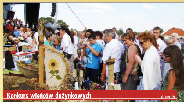
Konkurs wieńców dożynkowych