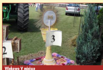
Wiekowo V miejsce