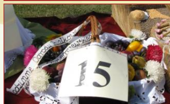
Witkowo (ogrody działkowe)