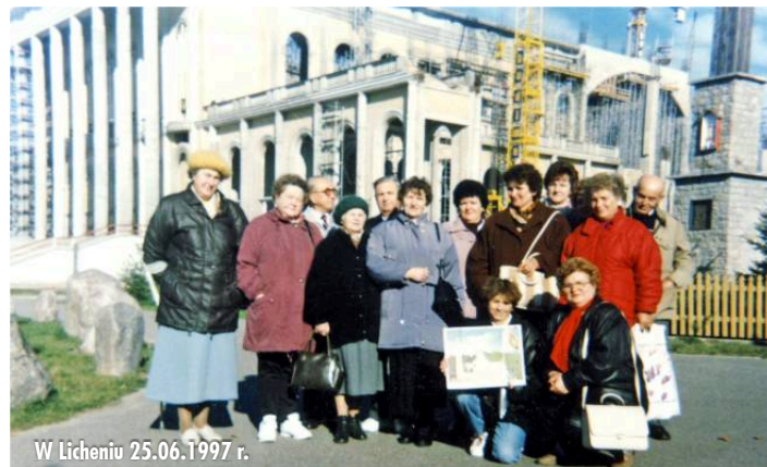
W Licheniu 25.06.1997 r.

„...Piastowie, Piastowie dzielni wojownicy mężnie strzegliście dostępu stolicy. My ich śladem podążamy Wielkopolskę zwiedzamy”.