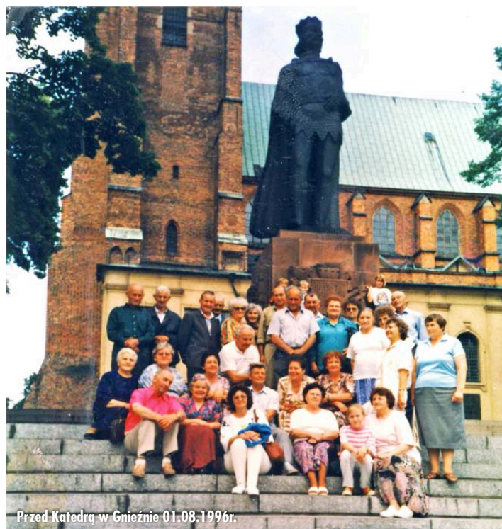
Przed Katedrą w Gnieźnie 01.08.1996r.

wyjazd zorganizowany został 27.09.1995r.) w celu oddania się uczestników wyciszeniu duchowemu. Tam w obecności cudownego obrazu można w skupieniu oddać się modlitwie. Ta inicjatywa jest kontynuowana przez Związek każdego roku w maju i w miarę zainteresowania również w okresie jesiennym. Uczestnikami są nie tylko członkowie PZERiI, ale także ludzie spoza naszej organizacji. Uczestnicy tych wyjazdów oprócz przeżyć duchowych zapoznają się z historią kościoła św. Doroty i cudownego obrazu, a przede wszystkim podziwiają Bazylikę i jej architekturę. Dla upamiętnienia naszych wizyt w Licheniu, członkowie naszego Oddziału Rejonowego ufundowali w 2002r. pamiątkową tablicę umieszczoną w pobliżu