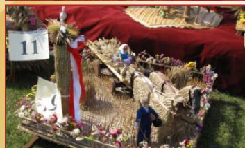
Mąkownica IV miejsce