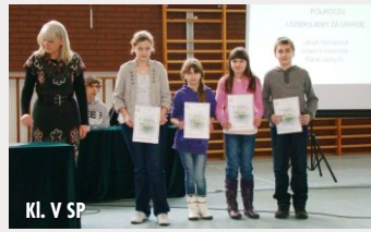
Kl. V SP