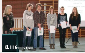
Kl. III Gimnazjum