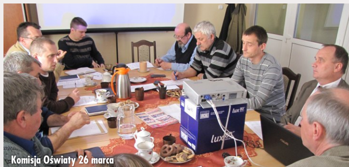
Komisja Oświaty 26 marca

posiedzenie Komisji Rewizyjnej. Komisja dokonała kontroli funkcjonowania Zakładu Gospodarki Komunalnej, szczególnie w zakresie gospodarki finansowej oraz kontroli ściągłości podatków lokalnych w 2011r. Nieprawidłowości nie stwierdzono.