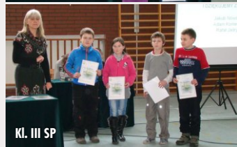
Kl. III SP