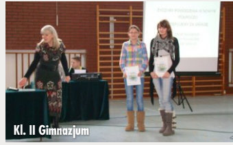
Kl. II Gimnazjum