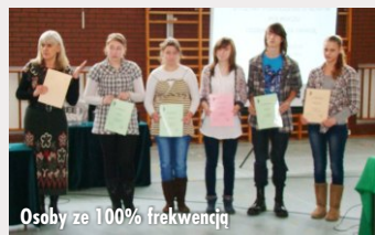
Osoby ze 100% frekwencją