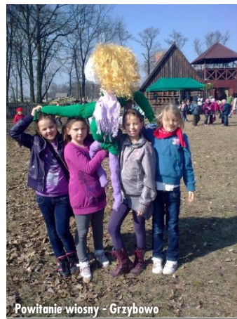
Powitanie wiosny - Grzybowo