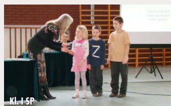
Kl. I SP