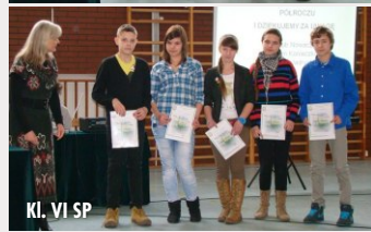
Kl. VI SP