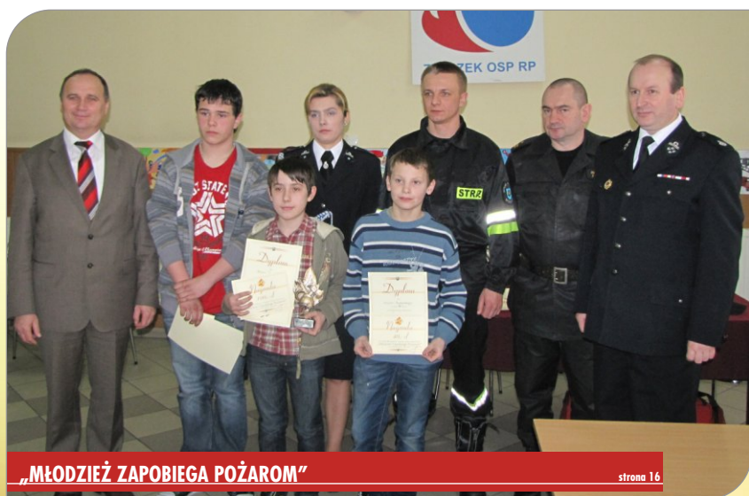
„MŁODZIEŻ ZAPOBIEGA POŻAROM”