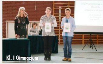
Kl. I Gimnazjum