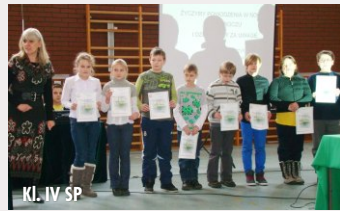
Kl. IV SP