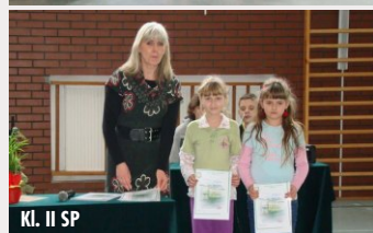
Kl. II SP