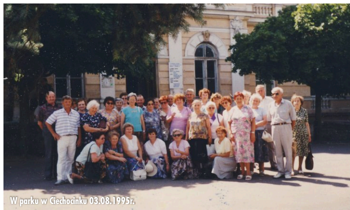
W parku w Ciechońku 03.08.1995r.