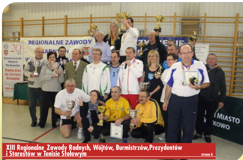
XIII Regionalne Zawody Radnych, Wójtów, Burmistrzów, Prezydentów i Starostów w Tenisie Stołowym