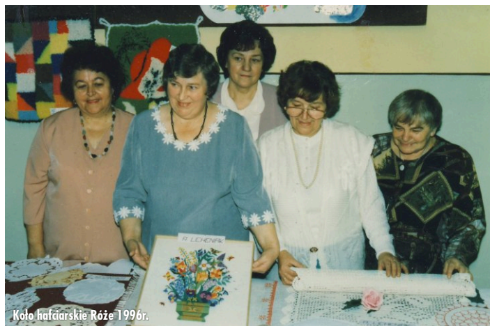
Koło haftarskie „Róże” 1996r.

Ważnym wydarzeniem była uroczystość wręczenia sztandaru dla Oddziału Miejskiego