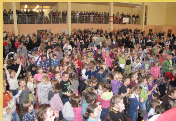
Clown Circus Show strona 15