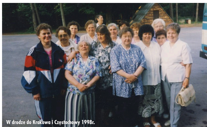
W drodze do Krakowa i Częstochowy 1998r.

Cenną inicjatywą jaka została podjęta przez Zarząd Koła to organizowanie „Dnia