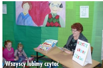
Wszyscy lubimy czytać