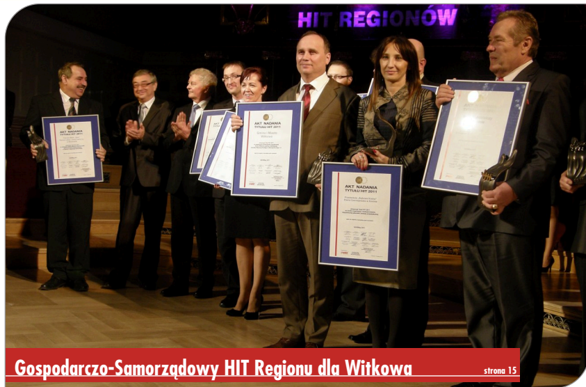
Gospodarczo-Samorządowy HIT Regionu dla Witkowa