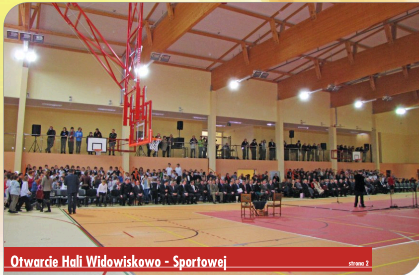
Otwarcie Hali Widowiskowo - Sportowej