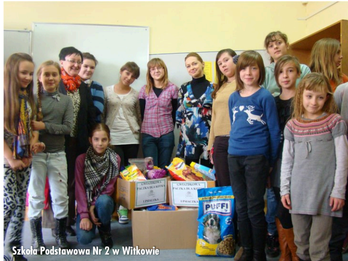
Szkoła Podstawowa Nr 2 w Witkowie

Przez dwa tygodnie trwała w Witkowie akcja Towarzystwa Opieki nad Zwierzętami pt. „Gwiazdkowa paczka dla kotka i psiaczka”, której celem oprócz zbiórki kocich i psich przysmaków dla schronisk w Gnieźnie i Radlinie oraz „kocich gniazd” na terenie Witkowa, było propagowanie wśród dzieci i młodzieży świadomej adopcji zwierząt.