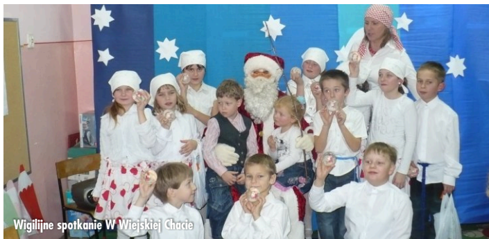
Wigilijne spotkanie W Wiejskiej Chacie

12 XII 2011r. uczniowie kl. IV - VI wraz z nauczycielami wzięli udział w wycieczce do Muzeum Regionalnego im. Dzieci Wrzesińskich, które mieści się we Wrześni. W muzeum dzieci miały okazję zobaczyć izbę szkolną z przełomu XIX/XX w. z pamiątkami z okresu strajku szkolnego, saloniki mieszczańskie, zbiory dokumentujące dzieje