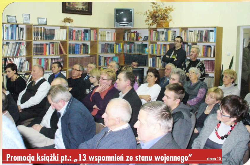
Promocja książki pt.: „13 wspomnień ze stanu wojennego”