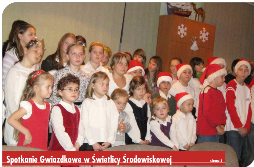
Spotkanie Gwiazdkowe w Świetlicy Środowiskowej