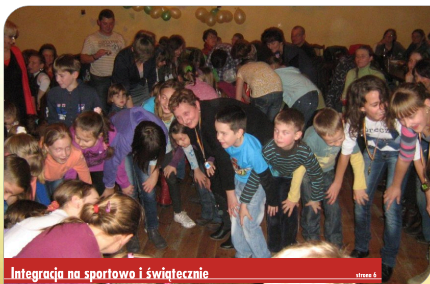
Integracja na sportowo i świątecznie