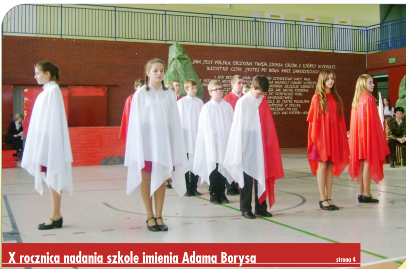
X rocznica nadania szkole imienia Adama Borysa