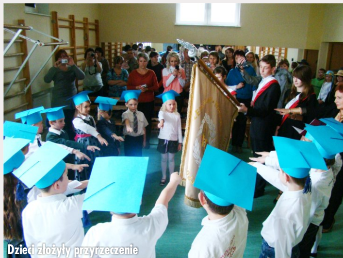
Dzieci złożyły przyrzeczenie

Gdy wraz z początkiem września po raz pierwszy przekraczali mury „podstawówki”, towarzyszyła im obawa, ale także i ciekawość połączona z ekscytacją. Czekal na nich nowy, zupełnie inny świat.