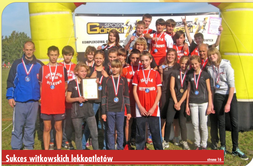
Sukces witkowskich lekkoatletów