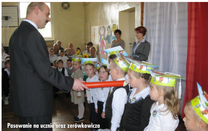
Pasowanie na ucznia oraz zerówkowicza

13 października najmłodsze dzieci oraz uczniowie naszej szkoły obchodzili święto. W tym ważnym dniu nasi milusińscy zdawali swój pierwszy w życiu egzamin z wiedzy tudzież umiejętności szkolnych. Dzieci m.in. recytowały wiersze, śpiewały piosenki, wykazały się znajomością alfabetu i zasad