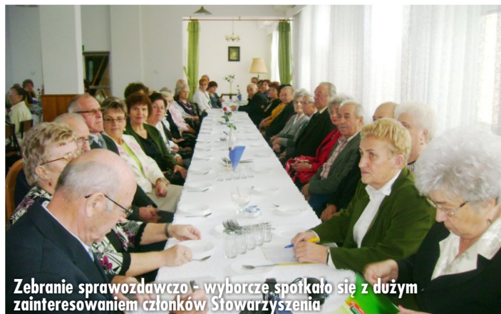
Zebranie sprawozdawczo - wyborcze spotkało się z dużym zainteresowaniem członków Stowarzyszenia

Podziękowanie dla zarządu witkowskiego oddziału „Promyk” przekazała także Prezes Zarządu Stowarzyszenia Centrum