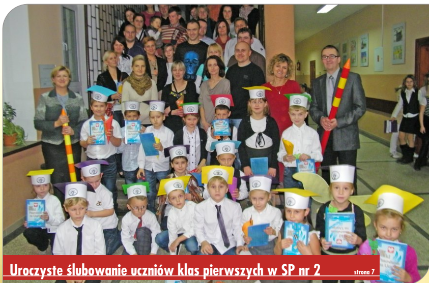
Uroczyste ślubowanie uczniów klas pierwszych w SP nr 2