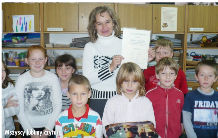
Wszyscy lubimy czytać