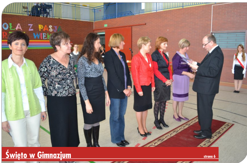
Święto w Gimnazjum