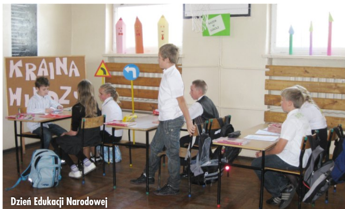
Dzień Edukacji Narodowej

19 i 28 października uczniowie klasy V - w tym przedstawiciele Samorządu Uczniowskiego udali się wraz z nauczycielami do Czajek, gdzie mieści się tablica