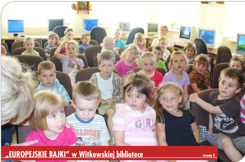
„EUROPEJSKIE BAJKI” w Witkowskiej bibliotece