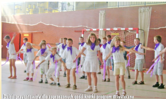
Dzieci przygotowały dla zaproszonych gości krótki program artystyczny