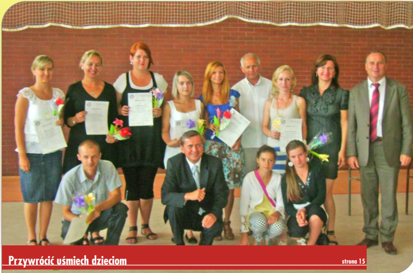
Przywrócić uśmiech dzieciom