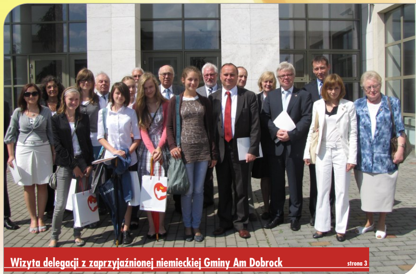
Wizyta delegacji z zaprzyjaźnionej niemieckiej Gminy Am Dobrock