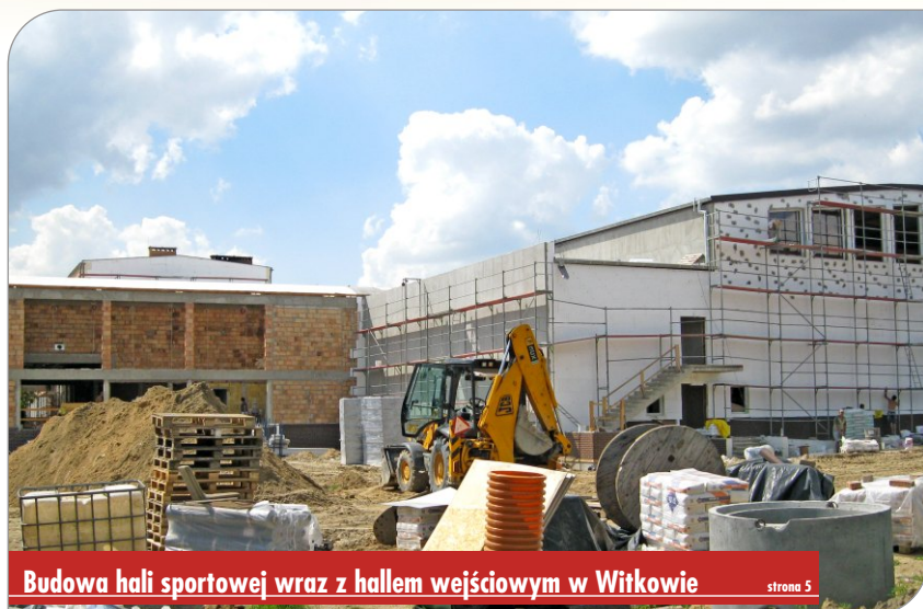
Budowa hali sportowej wraz z hallem wejściowym w Witkowie