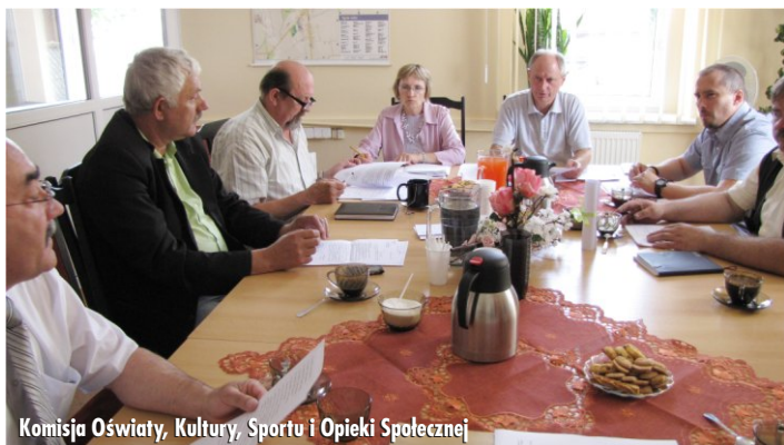
Komisja Oświaty, Kultury, Sportu i Opieki Społecznej

- uchwałę Nr VII/63/2011 o wysokości i warunkach udzielania bonifikat od opłat z tytułu przekształcenia wieczystego użytkowania we własność;