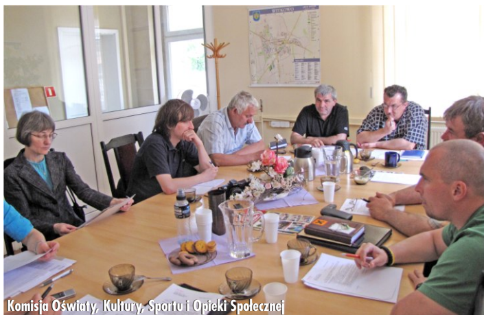
Komisja Oświaty, Kultury, Sportu i Opieki Społecznej

z wydatkami w oświacie za I kwartał br., i z realizacją Programu Rozwoju Turystyki i Rekreacji. Komisja ponadto wysłuchała informacji Dyrektora OKSiR-u o stanie obiektów sportowych, informacji Dyrektora Biblioteki Publicznej o działalności Bibliotek oraz zapoznała się z funkcjonowaniem Świątlicy Środowiskowej.