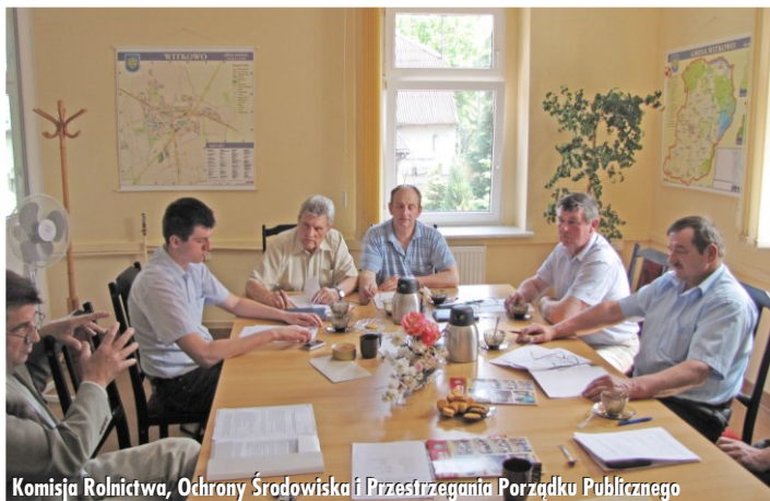
Komisja Rolnictwa, Ochrony Środowiska i Przestrzegania Porządku Publicznego

W dniu 5 maja Komisja Rewizyjna rozpoczęła procedurę związaną z kontrolą wykonania budżetu gminy i miasta za 2010. r. i wypracowaniem wniosku dotyczącego absolutorium dla Burmistrza Gminy i Miasta.