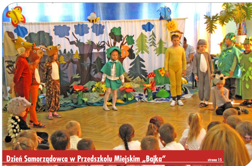
Dzień Samorządowca w Przedszkolu Miejskim „Bajka”