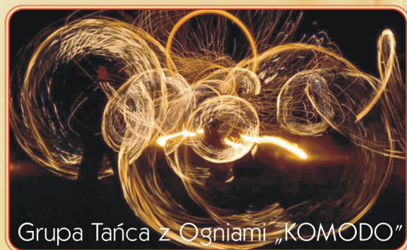
Grupa Tańca z Ogniami „KOMODO”