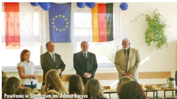
Powitanie w Gimnazjum im. Adama Borysa

Oprócz zmagania kulinarnych na uczestników spotkania czekały również inne atrakcje.