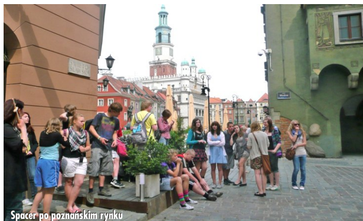
Spacer po poznańskim rynku

tradycyjną recepturę wyrobu najlepszych w Polsce pierników, a następnie sama zabrała się do wypieku. Przez wszystkie dni pobytu uczniowie poznawali słownictwo związane z jedzeniem, a na zakończenie wzięli udział w polsko - niemieckim konkursie z zakresu tematycznego „jedzenie”. Goście z Niemiec musieli się również przyznać, co najbardziej