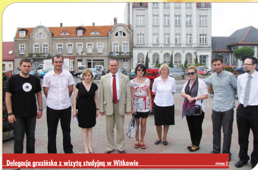
Delegacja gruzińska z wizytą studyjną w Witkowie