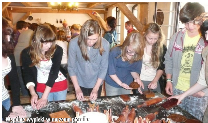
Wspólne wypieki w muzeum piernika

spotkań polsko - niemieckich, a na zakończenie zaśpiewali wspólnie polską i niemiecką piosenkę. Potem był już tylko czas na łzy i rozpoczęcie odliczania do naszej wrześniejszej wizyty w Cadenberge, którą zaplanowano na 12 - 17 września.