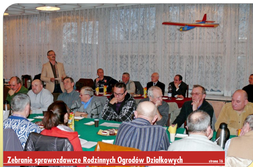
Zebranie sprawozdawcze Rodzinych Ogrodów Działkowych