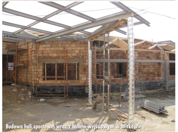
Budowa hali sportowej wraz z hollem wejściowym w Witkowie

Wykonano już ca 45% całości robót, tj. roboty stanu surowego, drenaż opaskowy, przyłącze sieci wodociągowej, instalację kanalizacji budynku. Na ukończeniu są przyłącza i zewnętrzna instalacja kanalizacji sanitarnej i deszczowej, instalacja ciepłownicza i konstrukcja dachu z drewna klejonego. • trwają prace przy budowie kanalizacji sanitarnej z przykanalikami i przepompowniami w miejscowościach: Odrowąż, Malenin, Mąkownica, Gorzykowo i Malachowo Kepe. Wykonawcą jest Zakład Robót Inżynieryjno-Hydrrotechnicznych „POL-GAR” Polus i Garnetz S.J. z Wągrowa.