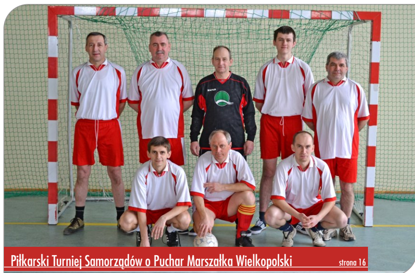
Piłkarski Turniej Samorządów o Puchar Marszałka Wielkopolski strona 16