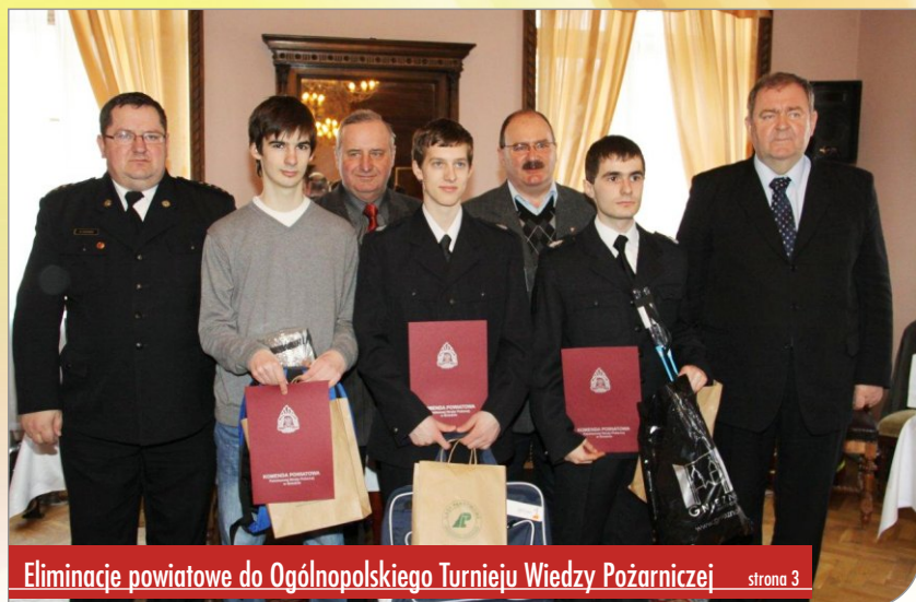
Eliminacje powiatowe do Ogólnopolskiego Turnieju Wiedzy Pożarniczej strona 3