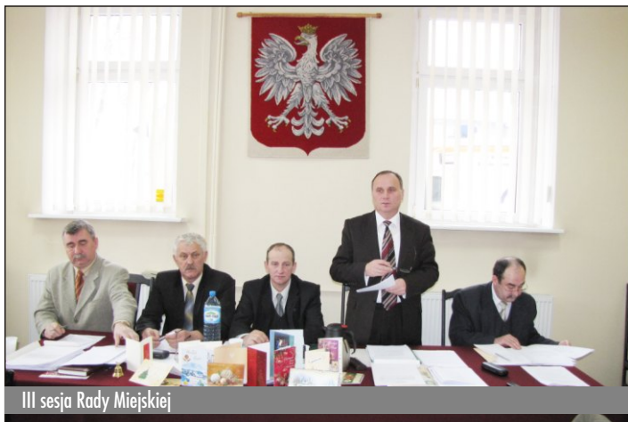
III sesja Rady Miejskiej