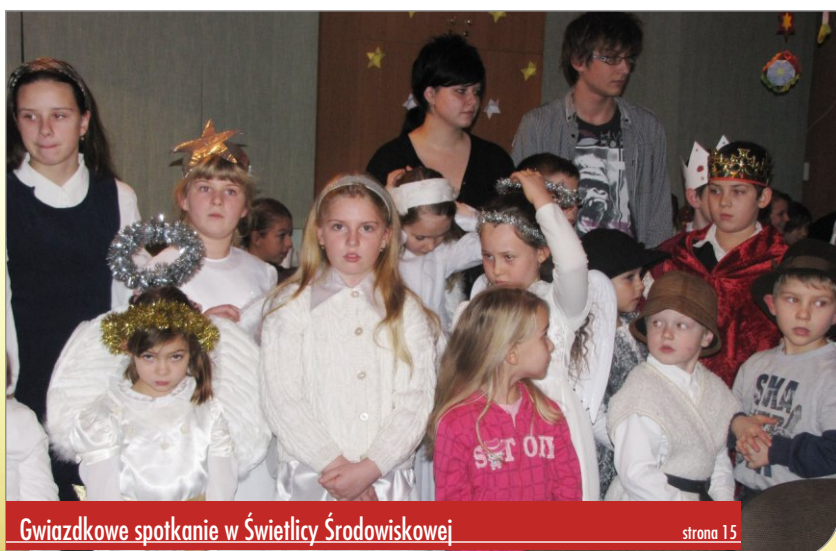
Gwiazdkowe spotkanie w Świetlicy Środowiskowej strona 15