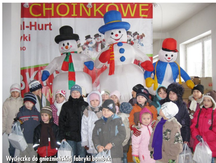
Wycieczka do gnieźnieńskiej fabryki bombek