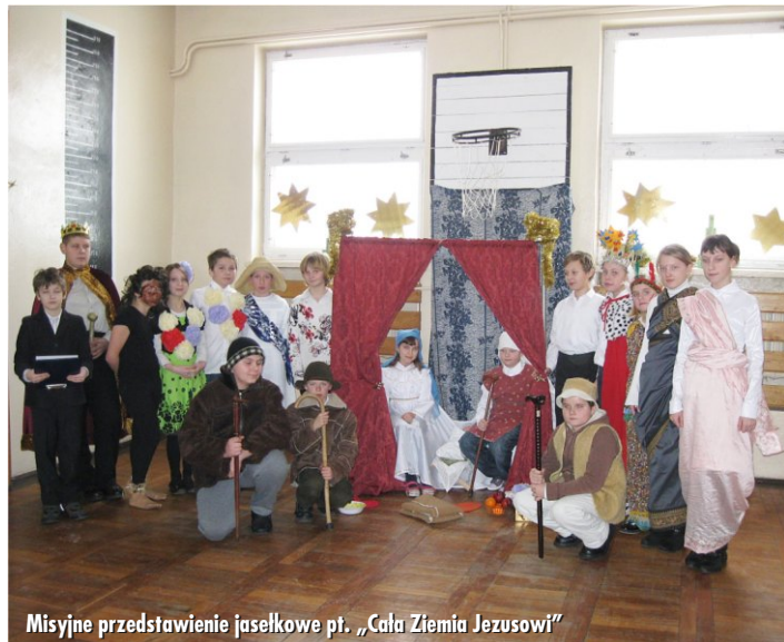
Misyjne przedstawienie jasełkowe pt. „Cała Ziemia Jezusowi”

Na zakończenie przewodniczący Samorządu Uczniowskiego złożył wszystkim zebranym życzenia świąteczne i noworoczne. Uczniowie z kółka taneczno - muzycznego