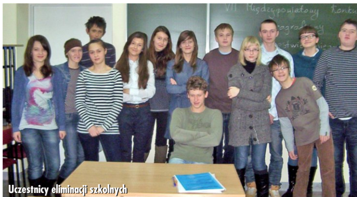
Uczestnicy eliminacji szkolnych

We wtorek 21 grudnia 2010 r. w Gimnazjum im. Adama Borysa w Witkowie odbyły się eliminacje szkolne VII Międzypowiatowego Konkursu Geograficznego „W królestwie śniegu i lodu”.