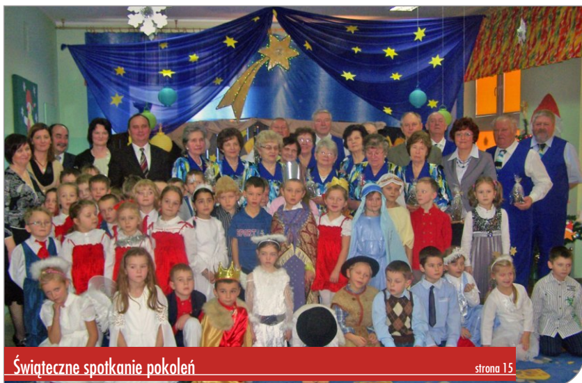
Świąteczne spotkanie pokoleń strona 15

Więcej informacji o nadchodzącym spisie na stronie 14