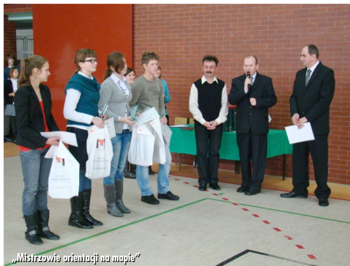
„Mistrzowie orientacji na mapie”

Od października w witkowskim gimnazjum trwał Szkolny Konkurs Geograficzny „Mistrz orientacji na mapie”. Celem konkursu było poszerzenie wiedzy geograficznej poprzez rozwijanie umiejętności uczniów w pracy z różnymi mapami jako źródłem informacji. W ramach konkursu przeprowadzone zostały eliminacje oraz cztery etapy, które doprowadziły do wyłonienia czwórki finalistów. Na początku grudnia odbył się finał konkursu, podczas którego uczniowie walczyli o najwyższe miejsce na podium.