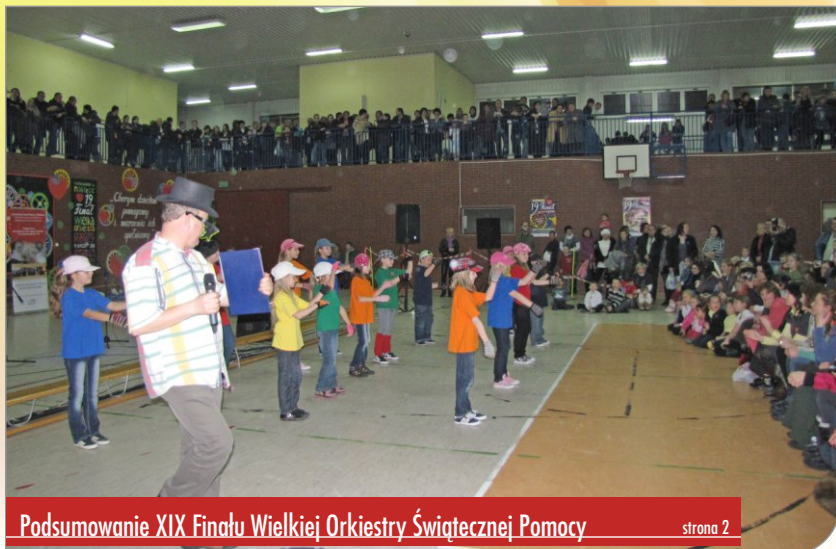
Podsumowanie XIX Finału Wielkiej Orkiestry Świątecznej Pomocy strona 2