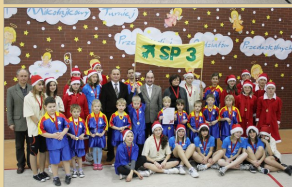
Mieszkańcy Gminy Witkowo wybrali swoich przedstawicieli w wyborach samorządowych