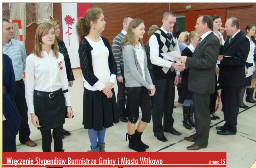
Wręczenie Stypendiów Burmistrza Gminy i Miasta Witkowo