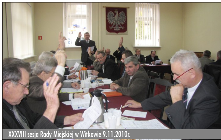
XXXVIII sesja Rady Miejskiej w Witkowie 9.11.2010r.

W dniu 4 listopada br. odbyło się wspólne posiedzenie Komisji Finansów, Komisji Szkolnictwa i Komisji Rolnictwa. Głównym celem posiedzenia było wypracowanie propozycji stawek podatkowych na 2011r. oraz zaopiniowanie pozostałych tematów, mających być przedmiotem obrad sesji listopadowej.