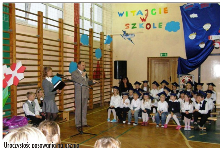
Uroczystość pasowania na ucznia

dużym zainteresowaniem. Dzieci zadawały wiele pytań na temat nowo poznanego kraju. Interesowała ich, między innymi, panująca tam religia - islam i charakterystyczne dla niej świątynie - meczety. Największe wrażenie wywarły Sulejmana Wspaniałego i Błękitny. Ciekawostką dla nich było to, że jedną z form wyznawania islamu jest taniec podobny do baletu, wykonywany przez muzułmańskich zakonników „wirujących derwiszy”. Uczniowie mieli możliwość obejrzenia figurki przedstawiającej derwisza w charakterystycznym nakryciu głowy i długiej białej szacie. Z dużą uwagą wszyscy słuchali historii o wojnie trojańskiej, a w szczególności o będącym jej symbolem drewnianym koniu, którego replikę można obejrzeć w ruinach Troi. Zainteresowanie wzbudziły również tureckie cuda natury - Pamukkale (Bawelniany Zamek) i Kapadocja (Kraina Pięknych Koni). Podsumowaniem zdobytych wiadomości o nowo poznanym kraju będzie konkurs plastyczny przeprowadzony przez wychowawców świetlicy szkolnej, którego rozstrzygnięcie nastąpi w listopadzie. (mk)