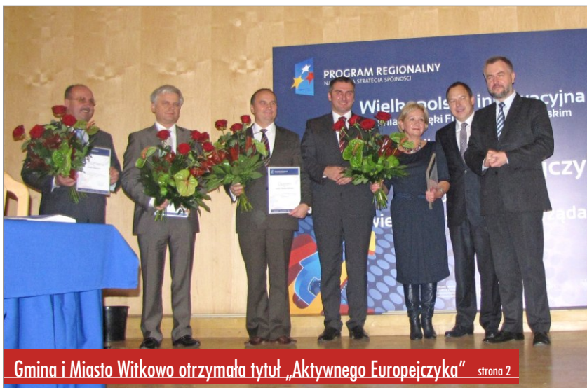
Gmina i Miasto Witkowo otrzymała tytuł „Aktywnego Europejczyka”