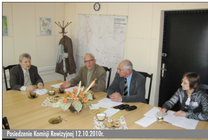
Posiedzenie Komisji Rewizyjnej 12.10.2010r.

W dniu 8 października odbyła się nadzwyczajna sesja Rady Miejskiej w Witkowie, na której Rada uchwaliła Nr XXXVI/325/10 dokonała zmian w budżecie gminy i miasta na 2010r.