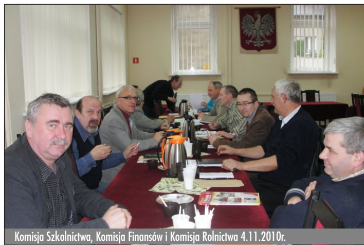
Komisja Szkolnictwa, Komisja Finansów i Komisja Rolnictwa 4.11.2010r.