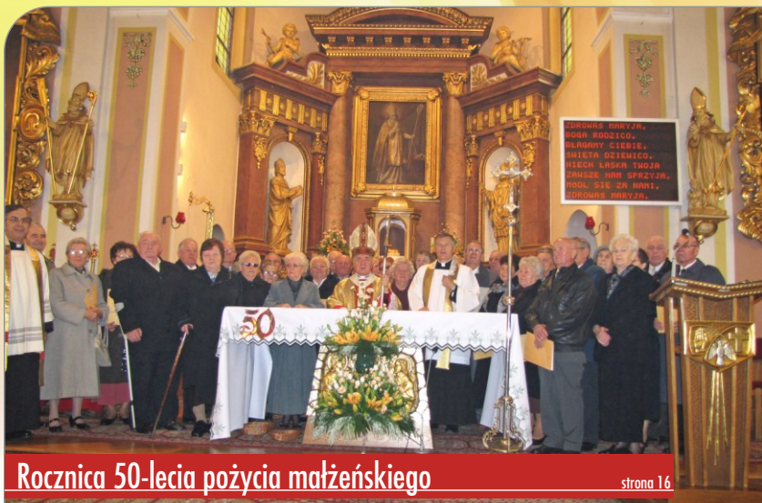
Rocznica 50-lecia pożycia małżeńskiego