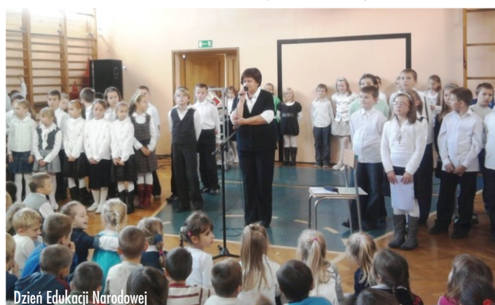
Dzień Edukacji Narodowej