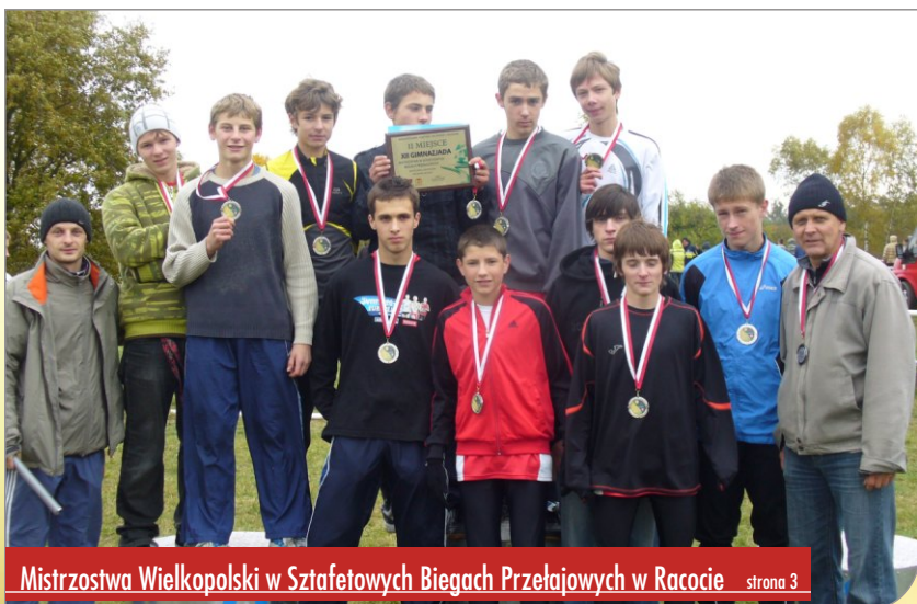
Mistrzostwa Wielkopolski w Sztafetowych Biegach Przelajowych w Racocie