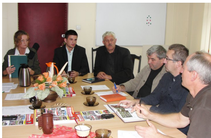
Komisja Finansów 28.09.2010r.

W dniu 28 września odbyło się posiedzenie Komisji Finansów i Rozwoju Społeczno-Gospodarczego. Komisja zapoznała się z informacją o sprzedaży mienia komunalnego w br. oraz z sytuacją finansową Zakładu Gospodarki Komunalnej za 8 miesięcy br. Wspólnie z Komendantem