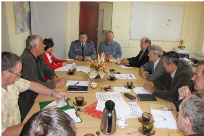
Komisja Rolnictwa 13.09.2010r.

- uchwałę Nr XXXIV/317/10 dotyczącą konsultacji z organizacjami pozarządowymi i pożytku publicznego;