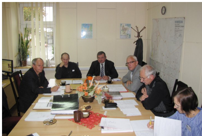
Komisja Finansów 15.09.2010r.

sołtysa w Małachowie Kępym); - uchwałę Nr XXXIV/321/10 zmieniającą uchwałę Nr XXXI/288/10 o pomocy finansowej Województwu Wielkopolskiemu na remont skrzyżowania drogi wojewódzkiej w Witkowie; - uchwałę Nr XXXIV/322/10 o zaciągnięciu kredytu na pokrycie deficytu w budżecie gminy;