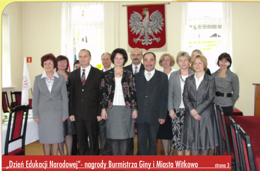
„Dzień Edukacji Narodowej”- nagrody Burmistrza Giny i Miasta Witkowo strona 3