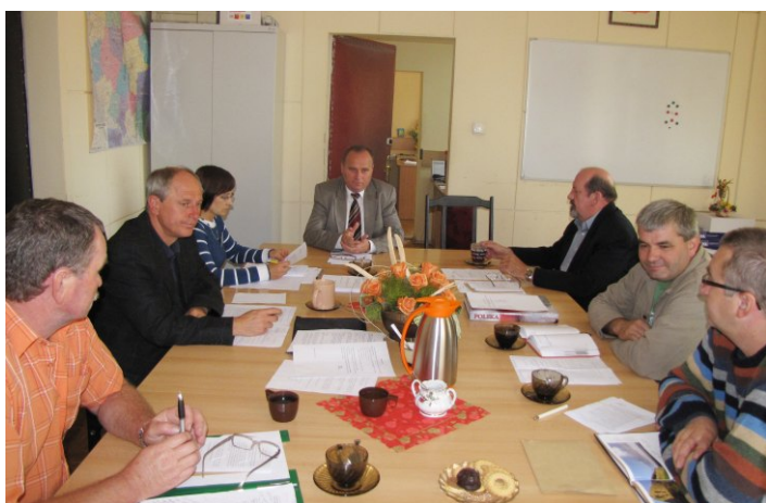
Komisja Szkolnictwa 14.09.2010r.

- uchwałę Nr XXXIV/320/10 zmieniającą uchwałę Nr XXVII/233/09 o inkasie podatku rolnego, leśnego i od nieruchomości (zmiana