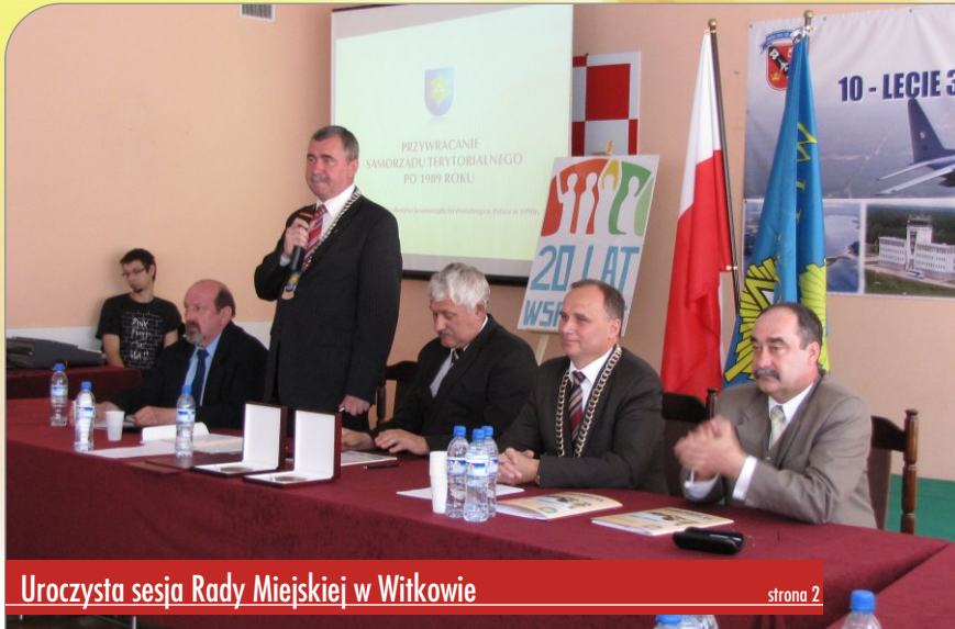
Uroczysta sesja Rady Miejskiej w Witkowie