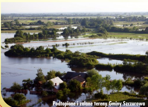
Podtopione i zalane tereny Gminy Szczurowa

W związku z klęską powodzi jaka nawiedziła szczególnie południową Polskę, na terenie Gminy Witkowo przeprowadzono zbiórkę plodów rolnych, żywności, środków czystości, itp. dla Gminy Szczurowa woj. małopolskie.