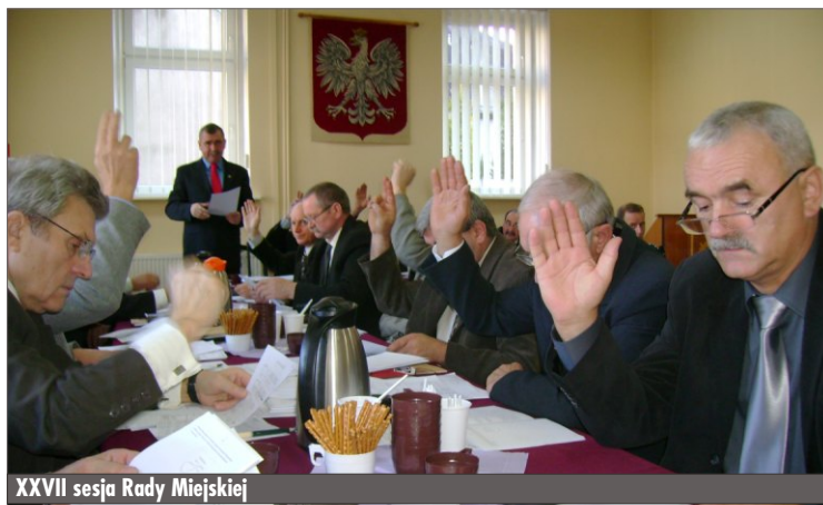
XXVII sesja Rady Miejskiej

W dniu 23 listopada Komisja Rolnictwa, Ochrony Środowiska i Przestrzegania Porządku Publicznego, a w dniu 27 listopada Komisja Szkolnictwa, Kultury, Sportu i Opieki Społecznej dokonały analizy projektu budżetu gminy i miasta na 2010r. Komisja Szkolnictwa ponadto zapoznała się z „Informacją o stanie