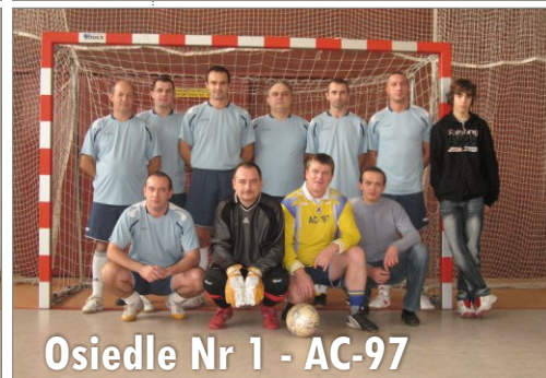
Osiedle Nr 1 - AC-97