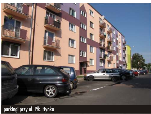
parkingi przy ul. Plk. Hynka