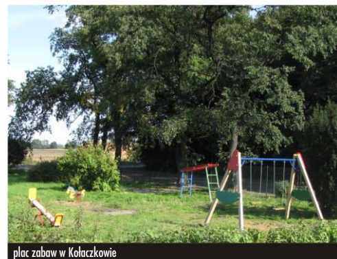
plac zabaw w Kołaczkowie

Czerniejewskiej oraz w Kołaczkowie. Wykonawcą było przedsiębiorstwo „SUN+” z Gruszczyna za kwotę: 64.989,40 zł. brutto.