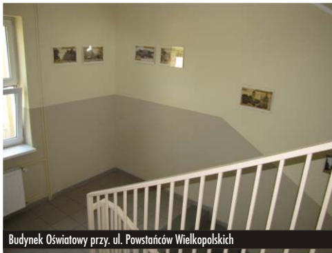
Budynek Oświatowy przy. ul. Powstańców Wielkopolskich