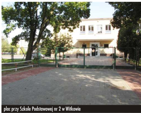
plac przy Szkole Podstawowej nr 2 w Witkowie

ul. Czerniejewska, Wykonawcą był ZGK z Witkowa za łączną kwotę 38.649,81zł brutto.