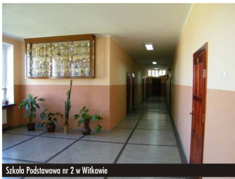
Szkoła Podstawowa nr 2 w Witkowie