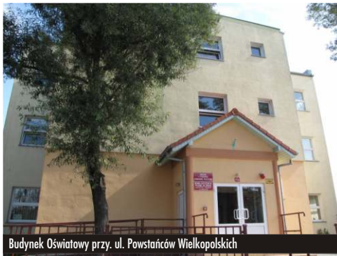
Budynek Oświatowy przy. ul. Powstańców Wielkopolskich