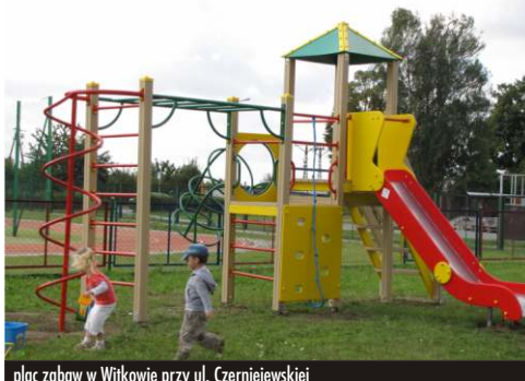
plac zabaw w Witkowie przy ul. Czerniejewskiej

Czerniejewskiej oraz w Kołaczkowie. Wykonawcą było przedsiębiorstwo „SUN+” z Gruszczyna za kwotę: 64.989,40 zł. brutto.