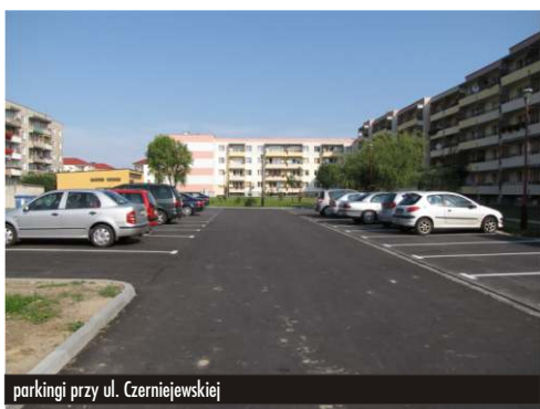
parkingi przy ul. Czerniejewskiej

powierzchni 1320m 2 . Pobudowano parkingi przy ul. Czerniejewskiej o powierzchni 900m 2 i Plk. Hynka o powierzchni 163m 2 . Wykonawcą było Przedsiębiorstwo Robót Drogowych z Gniezna za kwotę: 413493,36zł. brutto.