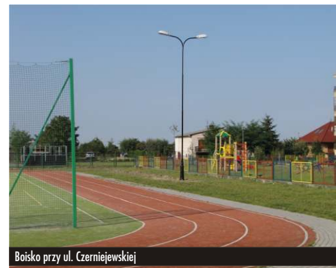
Boisko przy ul. Czerniejewskiej

i Wigury, Braci Łukowskich, Jasnej, na boisku przy ul. Czerniejewskiej, na terenie parków miejskich przy ul. Słowackiego i Wrzesińskiej.