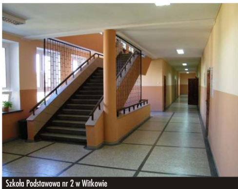
Szkoła Podstawowa nr 2 w Witkowie