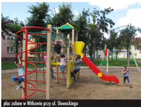
plac zabaw w Witkowie przy ul. Słowackiego