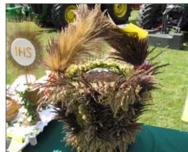
Małachowo Wierzbiczany 3 miejsce