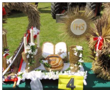
Jaworowo 2 miejsce