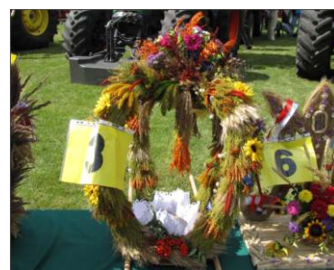
Małachowo Złych Miejsc