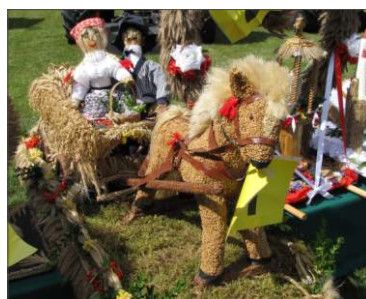
Gorzynkowo 1 miejsce