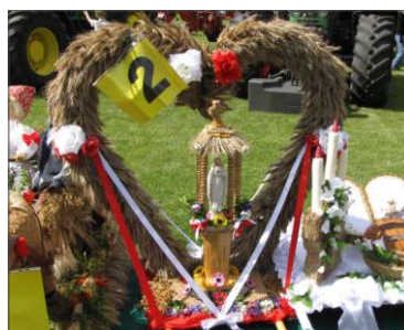
Mielżyn 3 miejsce