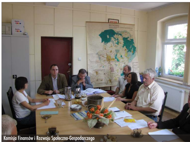
Komisja Finansów i Rozwoju Społeczno-Gospodarczego

Komisja Rolnictwa, Ochrony Środowiska i Przestrzegania Porządku Publicznego zapoznana się z ofertą Spółki Wodno-Ściekowej „Wody Polskie” dot. rozwiązania gospodarki ściekowej w Ostrowitym Prymasowskim. Zapoznano się również z przedstawioną przez przedstawiciela Urzędu Miejskiego w Gnieźnie informacją o realizacji