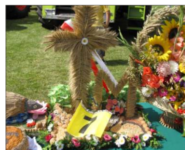
Ostrowite Prymasowskie 1 miejsce