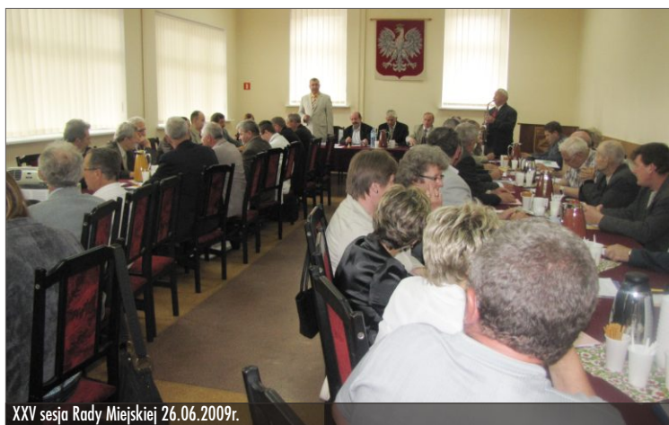
XXV sesja Rady Miejskiej 26.06.2009r.

sesja Rady Miejskiej. Rada wysłuchała informacji Burmistrza o działalności w okresie międzysesyjnym tj. od 1 maja do 25 czerwca br., informacji Komendanta Komisariatu Policji o zabezpieczeniu porządku publicznego w Ośrodku Wypoczynkowym w Skorzęcinie oraz