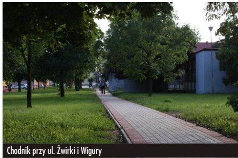
Chodnik przy ul. Żwirki i Wigury