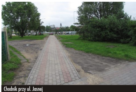
Chodnik przy ul. Jasnej