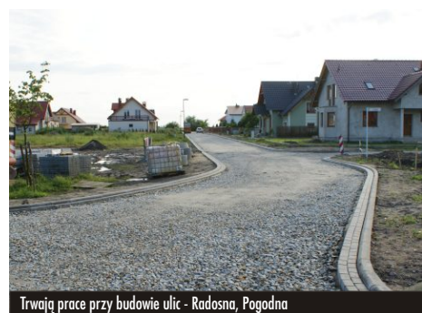
Trwają prace przy budowie ulic - Radosna, Pogodna