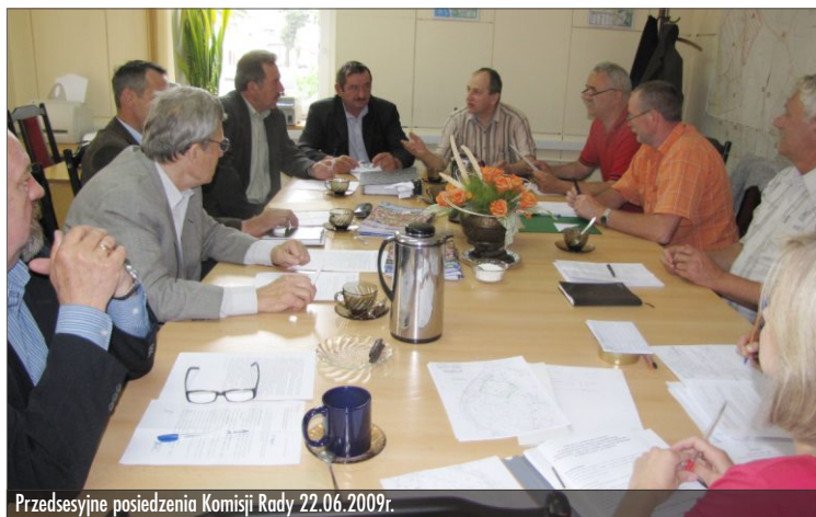
Przedsesyjne posiedzenia Komisji Rady 22.06.2009r.

przygotowania Ośrodka Wypoczynkowego w Skorzęcinie do sezonu letniego.