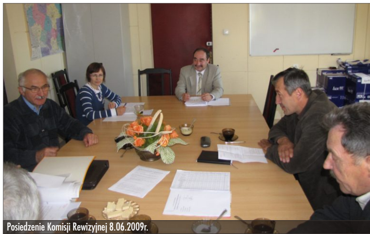
Posiedzenie Komisji Rewizyjnej 8.06.2009r.

W dniu 8 czerwca odbyło się posiedzenie Komisji Rewizyjnej. Komisja dokonała kontroli wybranego zamówienia publicznego - adaptacji budynku komunalnego w Ruchocinku na lokale mieszkalne oraz kontroli