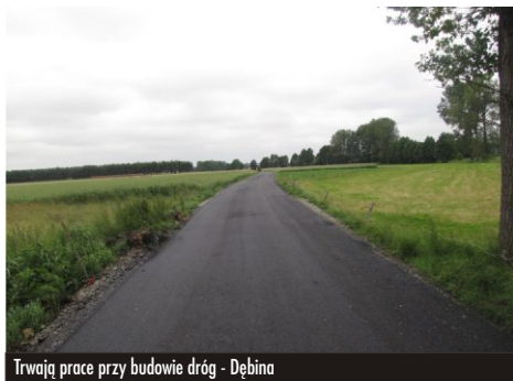
Trwają prace przy budowie dróg - Dębina