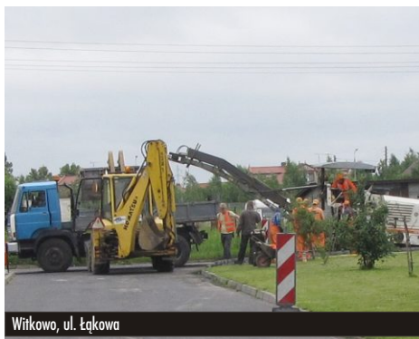
Witkowo, ul. Łąkowa