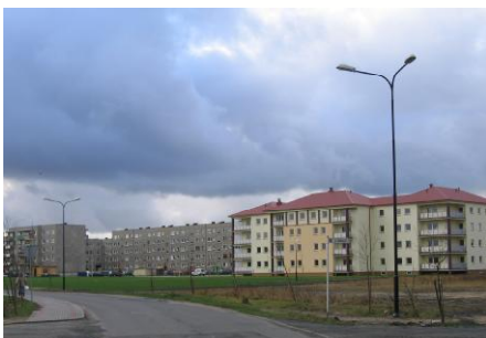
ul. Braci Łukowskich