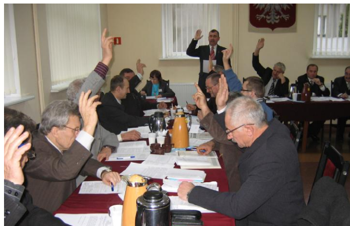
Sesja Rady Miejskiej

i przepompowniami w obrębie ulic: Strzałkowska, Zielona, Cmentarna, Wodociągowa, Skośna, Wrzesińska i Ogrodowa oraz zabezpieczeniu jej spłaty w formie weksla in blanco. Wysokość pożyczki - 1.600.000,-zł z tego 200.000,-zł w 2008r.