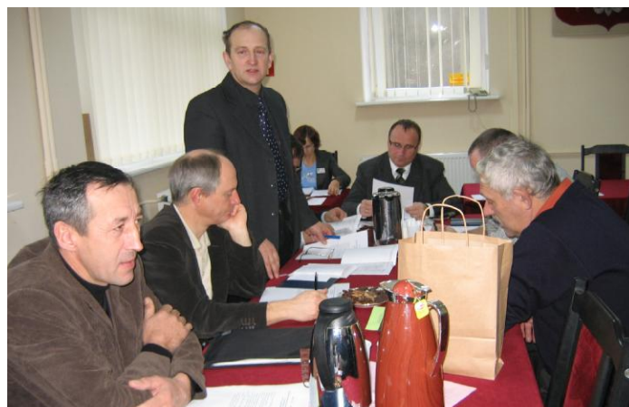
Wspólne posiedzenie Komisji Rolnictwa i Szkolnictwa