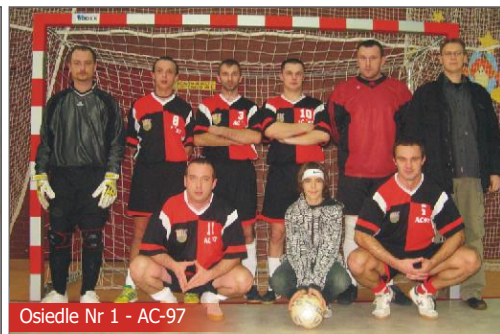
Osiedle Nr 1 - AC-97