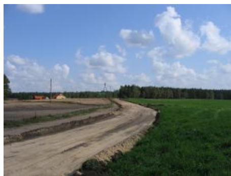
Budowa drogi w Skorzęcinie - Rybakówce