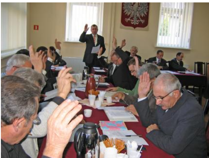
Sesja Rady Miejskiej