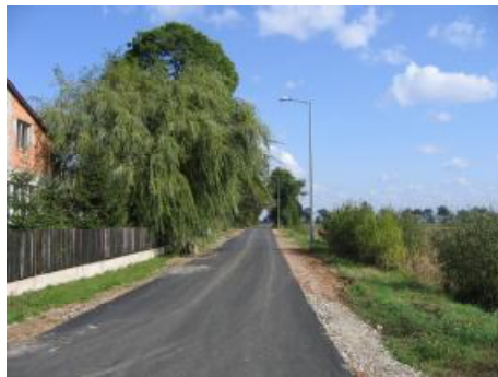
Małachowo Złych Miejsc