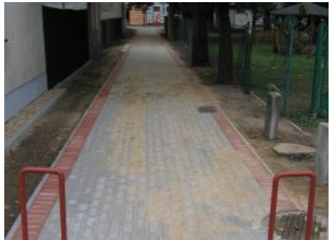
Chodnik między ul. Polną, a ul. Poznańską