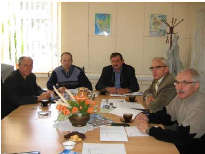
Posiedzenie Komisji Finansów

Rada Miejska zdecydowała przesunąć temat dotyczący uchwalenia miejscowego planu zagospodarowania przestrzennego terenów w Witkowie