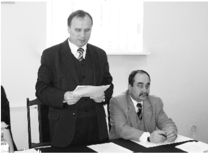
Burmistrz Gminy i Miasta przedstawił zebranim informacje o działalności międzysesyjnej

- uchwałę Nr XII/112/08 w sprawie dopłaty do ceny wody na rzecz odbiorców ze wsi Królewiec;