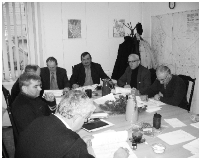
Komisja Finansów i Rozwoju Społeczno-Gospodarczego

W dniu 15 stycznia odbyło się posiedzenie Komisji Rolnictwa, Ochrony Środowiska i Przestrzegania Porządku Publicznego Rady Miejskiej w Witkowie. Komisja zapo-