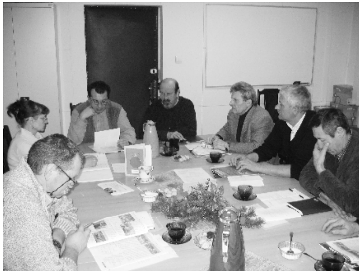
Komisja Rolnictwa, Ochrony Środowiska i Przestrzegania Porządku Publicznego

W dniu 14 stycznia odbyło się kolejne posiedzenie Komisji Rewizyjnej Rady Miejskiej w Witkowie. Komisja dokonała dwóch kontroli: kontroli działań podejmowanych przez Szkołę Podstawową Nr 2 w