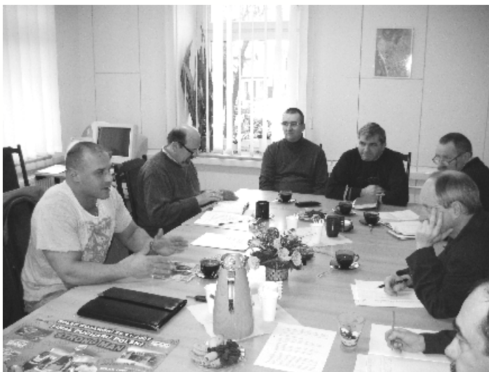
Komisja Szkolnictwa, Kultury, Sportu i Opieki Społecznej

i miasta na 2008r., przedstawionego przez Burmistrza i Skarbnika Gminy. Ponadto Komisja spotkała się z Powiatowym Lekarzem Weterynarii dla omówienia sprawy zwalczania choroby Aujeszkiego świń oraz z Dyrektorem Spółki ALKON i Kierownikiem ZGK dla omówienia sprawy segregacji nieczystości i koniecznej podwyżki opłat za skła-