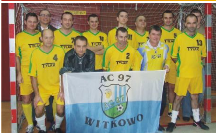
Zarząd Osiedla Nr 1 AC-97