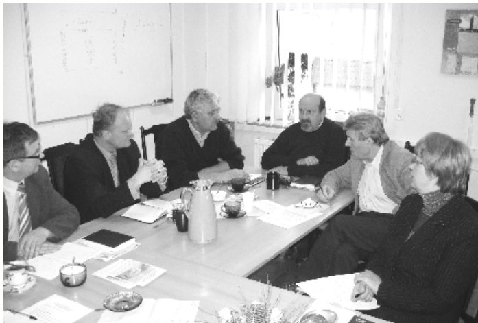
Komisja Rolnictwa, Ochrony Środowiska i Przestrzegania Porządku Publicznego

W dniu 27 listopada odbyło się posiedzenie Komisji Rolnictwa, Ochrony Środowiska i Przestrzegania Porządku Publicznego. Głównym tematem posiedzenia było zaopiniowanie projektu budżetu gminy