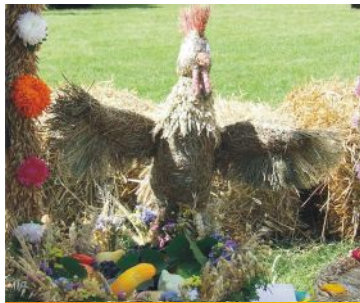
wieńiec nr 14 Folwark