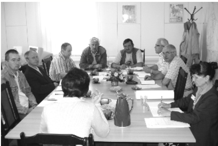
Komisja Finansów i Rozwoju Społeczno-Gospodarczego

W dniu 31 sierpnia odbyło się posiedzenie Komisji Finansów i Rozwoju Społeczno-Gospodarczego. Komisja zapoznała się z informacją nt. dowozu dzieci do szkół w