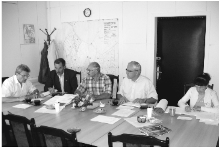
Posiedzenie Komisji Rewizyjnej

W dniu 28 sierpnia odbyło się posiedzenie Komisji Rolnictwa, Ochrony Środowiska i Przestrzegania Porządku Publicznego. Głównym