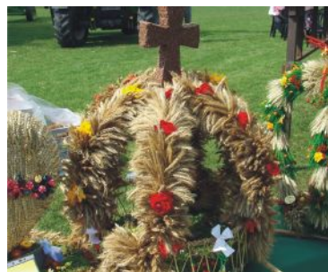
3 miejsce zajął wieńiec nr 2 z Malenina