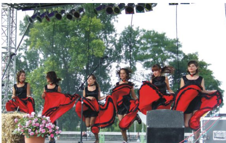
Dużym zainteresowaniem wśród publiczności cieszyły się występy zespołów szkolnych