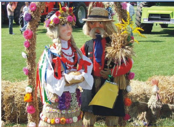
I miejsce zajął wieńiec nr 6 z Wiekowa