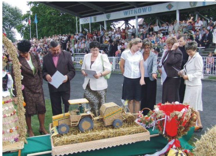
Komisja konkursowa, miała naprawdę ciężki orzech do zgryzienia aby wyłonić zwycięzcę