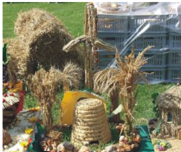
wieńiec nr 8 Małachowo Wierzbiczany