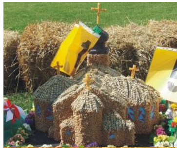
wieńiec nr 13 Witkówko