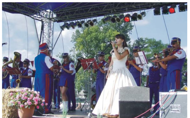
Obchody dożynek uświetnił koncert Orkiestry Dętej OSP ze Środy Wielkopolskiej