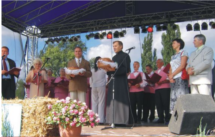
Starostowie przekazali Burmistrzowi GIM Witkowa oraz Proboszczowi Witkowskiej Parafii chleb wypieczony z tegorocznych zbóż

Dożynki największe w roku święto rolników będące ukoronowaniem ich całorocznego trudu, obchodzone po zebraniu plonów, a głównie plonu zbóż. Tegoroczne Święto Plonów w Gminie Witkowo odbyło się 26 sierpnia 2007 r.