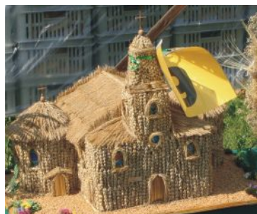
wieńiec nr 9 Witkówko