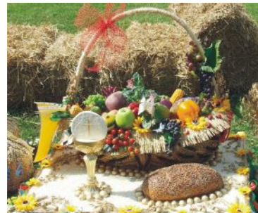
wieńiec nr 5 Jaworowo