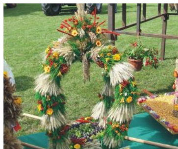
wieńiec nr 7 Małachowo Złych Miejsc