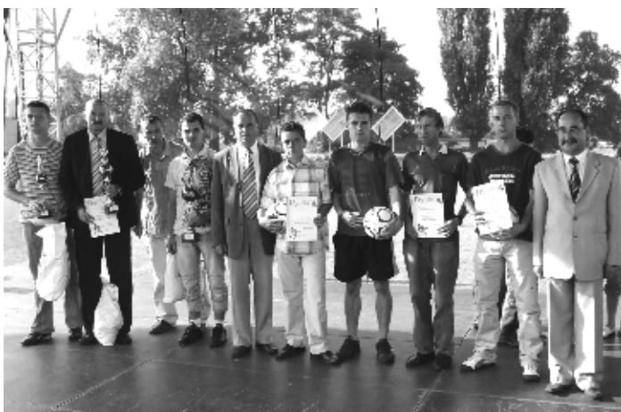
Wręczenie nagród zwycięzcom mistrzostw odbyło się w trakcie obchodów Dożynek Gminnych

grupach (2 grupy po 3 zespoły a 1 grupa 4 zespoły), grając systemem „każdy z każdym”. W wyniku rozegranych spotkań do półfinałów zakwalifikowały się sołectwa: Chładowo - Kamionka i lepsze okazało się sołectwo Chładowo pokonując