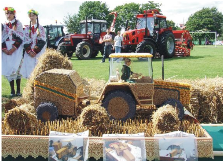
2 miejsce zajął wieńiec nr 10 z Gorzykowa