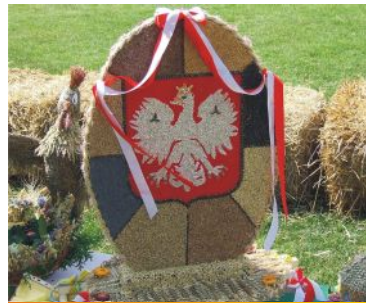
wieńiec nr 12 Mąkownica