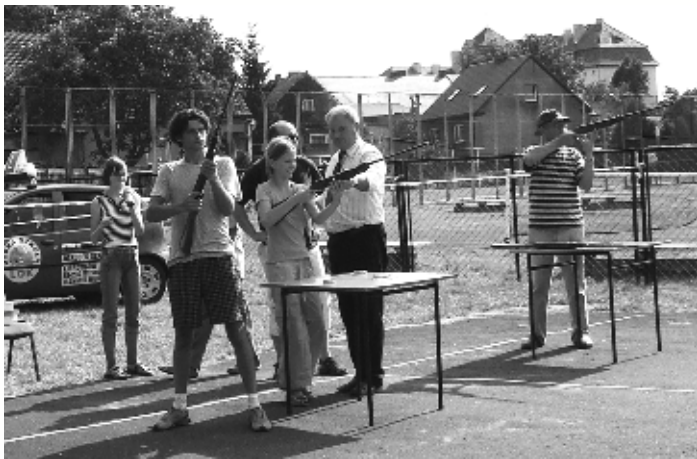
W zawodach strzeleckich z broni pneumatycznej wzięło udział 76 osób

rencje sportowo-rekreacyjne dla dzieci i młodzieży oraz osób dorosłych, które cieszyły się dużym zainteresowaniem. Dzieci rywalizowały w slalomie piłkarskim, żonglerce piłką nożną, biegach w workach, rzutami lotkami do tarczy oraz strzelali do mini-bramki. Nagrodami dla najlepszych były słodycze i sprzęt sportowy. Młodzież i osoby dorosłe próbowali swoich sił w: rzutach beretem, podnoszeniu ciężarka 17,5 kg, dożynkowym slalomie sprawnościowym, strzelali