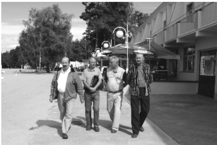
Komisja Szkolnictwa, Kultury, Sportu i Opieki Społecznej dokonała oględzin terenu Ośrodka Wypoczynkowego w Skorzęcinie

celem posiedzenia było dokonanie przez Komisję oględzin w terenie w zakresie utrzymania porządku i w zakresie ochrony środowiska na