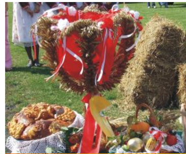
wieńiec nr 11 Ostrowite Prymasowskie