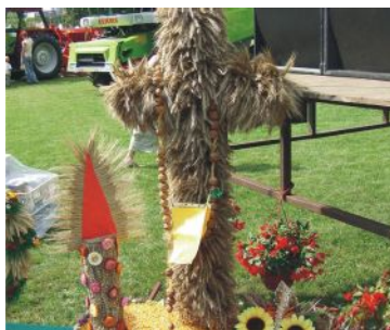
wieńiec nr 1 Ruchocinek