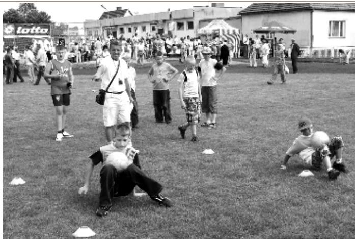
Konkurencje sportowe dla dzieci i młodzieży cieszyły się dużym zainteresowaniem

rywali w stosunku 2:0 a w drugim sołectwo Jaworowo pokonało Małachowo Złych Miejsc w stosunku 1:0. W meczu o 3 - 4 miejsce Małachowo Złych Miejsc pokonało Kamionkę w stosunku 10:1 a w wielkim finale sołectwo Chładowo pokonało sołectwo Jaworowo po bardzo wyrównanej walce w stosunku 4:1.