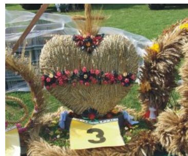
wieńiec nr 3 z Mielzyna