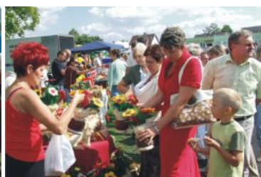
Dożynekowemu festynowi towarzyszyło wiele atrakcji: wystawy maszyn rolniczych, pokazy, stragany handlowe, można było również zapoznać się z produktami lokalnych wytwórców