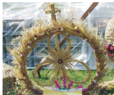
wieńiec nr 4 Ćwierdzin