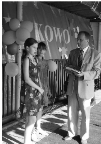
W trakcie obchodów Dni Witkowa uczestnicy konkursów odbierali nagrody z rąk Burmistrza