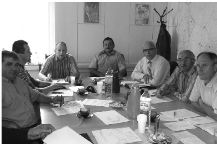
Komisja Finansów 27.06.2007 r.