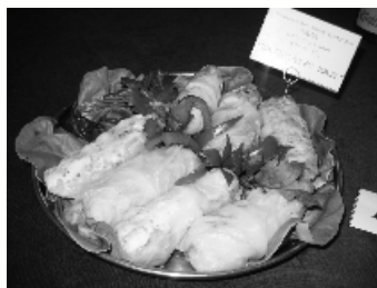
Gospodarstwo „AGROTURYSTYKA” w Wiekowie