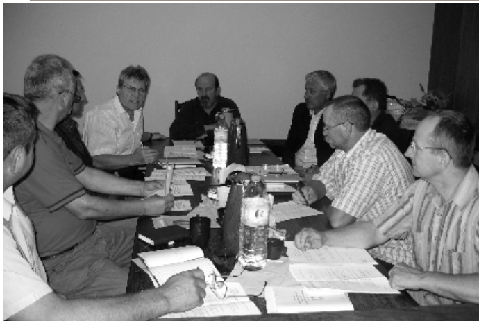
Komisja Rolnictwa 26.06.2007 r.

W dniu 11 czerwca odbyło się posiedzenie Komisji Rewizyjnej. Komisja dokonała kontroli przeprowadzonych przetargów. Szczegółowej kontroli poddano dokumentację dotyczącą przetargu na wykonanie remontu domków letniskowych i świetlicy w Ośrodku Wypoczynkowym w Skorzęcinie. Zastrzeżeń nie zgłoszono. Komisja ponadto zapoznała się z pismem dzierżawcy gruntu w Ośrodku w Skorzęcinie, dotyczącym czynszów dzierżawnych oraz