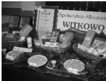
Spółdzielnia Mleczarska w Witkowie