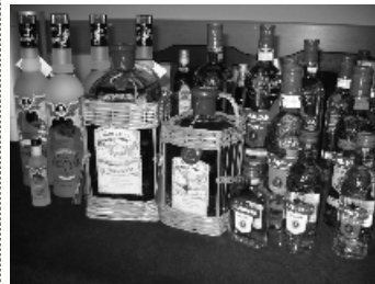
Sobieski Trade w Kołaczku