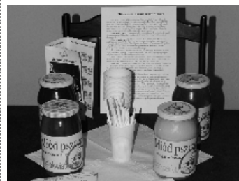
Gminne Koło Pszczelarskie