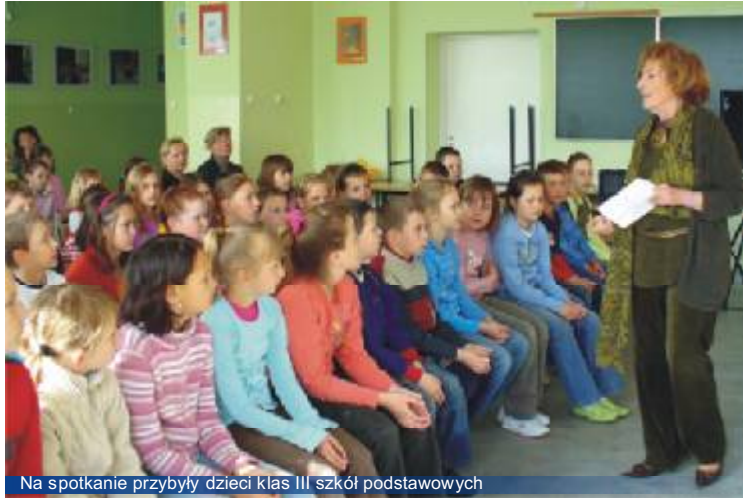
Na spotkanie przybyły dzieci klas III szkół podstawowych

Biblioteka Publiczna Miasta i Gminy Witkowo działa na podstawie Ustawy o bibliotekach, według której „Biblioteki publiczne służą zaspokajaniu potrzeb oświatowych, kulturalnych i informacyjnych ogółu społeczeństwa oraz uczestniczą w upowszechnianiu kultury.” Swoje zadania realizuje głównie poprzez książkę. Jednym z spośród wielu sposobów najgłębiej zapadającym w pamięci użytkowników, który zbliża czytelnika do książki i do biblioteki są spotkania autorskie. Tę działalność nasza biblioteka prowadzi od wielu już lat.