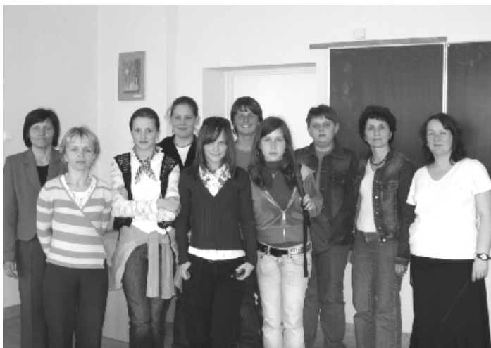
Uczestnicy konkursu Złotousty

W dn. 14 - 18 maja kolejny raz obchodziliśmy w naszej szkole Dni Kultury Języka Polskiego. Ta doroczna impreza ma na celu wzbudzenie w młodzieży polonistycznej ciekawości, uświadomienie na problemy kultury języka, podkreślenie wagi znajomości ojczystej mowy.