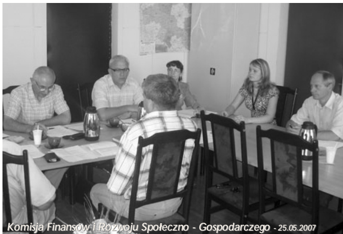
Komisja Finansów i Rozwoju Społeczno-Gospodarczego - 25.05.2007