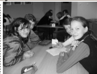
Uczestnicy konkursu w trakcie pracy

Tegoroczny Tydzień Kultury Języka Polskiego przeszedł do historii.