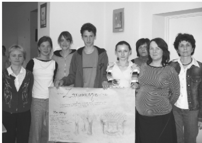
Zwycięzcy konkursu wiedzy o Panu Tadeuszu