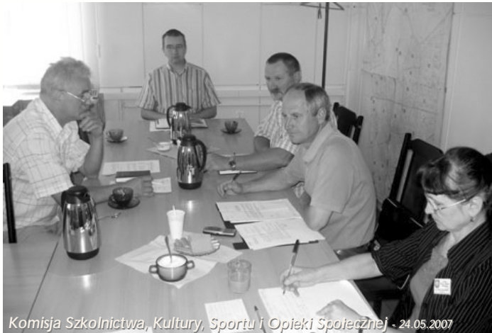
Komisja Szkolnictwa, Kultury, Sportu i Opieki Społecznej - 24.05.2007

W dniu 14 maja odbyło się posiedzenie Komisji Rewizyjnej. Kontrolowano działalność Uczniowskich Klubów Sportowych, funkcjonowanie hali sportowej przy Gimnazjum w Witkowie i Stadionu Miejskiego oraz stan boisk sportowych na terenach wiejskich.