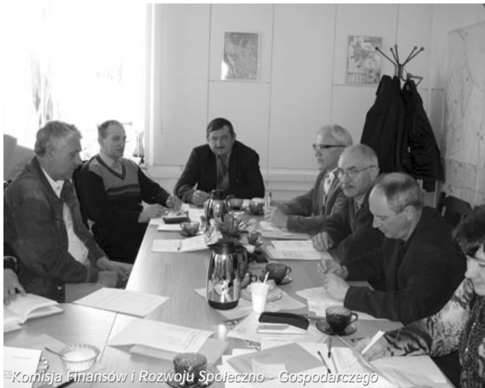
Komisja Finansów i Rozwoju Społeczno-Gospodarczego