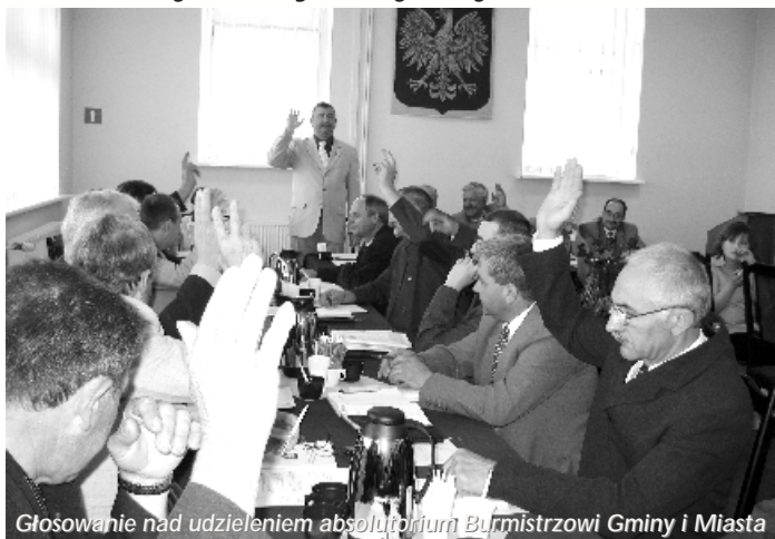
Głosowanie nad udzieleniem absolutorium Burmistrzowi Gminy i Miasta

W dniu 27 kwietnia odbyła się VI sesja Rady Miejskiej. Rada wysłuchała informacji Burmistrza Gminy i Miasta o działalności międzyseesyjnej, sprawozdania z działalności Burmistrza i Urzędu Gminy i Miasta za 2006r. oraz sprawozdania z realizacji „Strategii zrównoważonego rozwoju Gminy i Miasta Witkowo”.