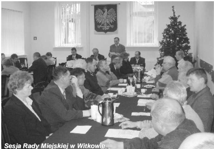
Sesja Rady Miejskiej w Witkowie

W dniu 29 grudnia odbyła się III sesja Rady Miejskiej. Rada wysłuchała: