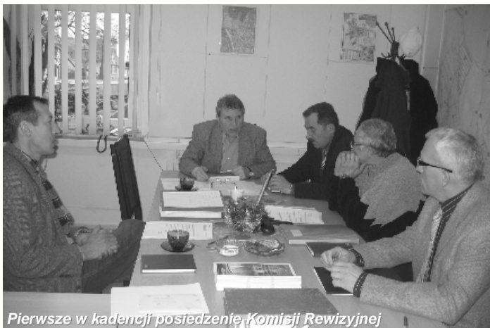
Pierwsze w kadencji posiedzenie Komisji Rewizyjnej

W dniu 14 grudnia odbyło się pierwsze w kadencji posiedzenie Komisji Rewizyjnej. Głównym celem posiedzenia było opracowanie planu pracy Komisji na 2007r. Posiedzenie było też okazją do długiej dyskusji na temat celu i zadań Komisji, rodzajów kontroli, procedury opracowywania wniosku absolutoryjnego oraz na temat problemów i spraw, z jakimi Komisja zetknęła się w poprzedniej kadencji.