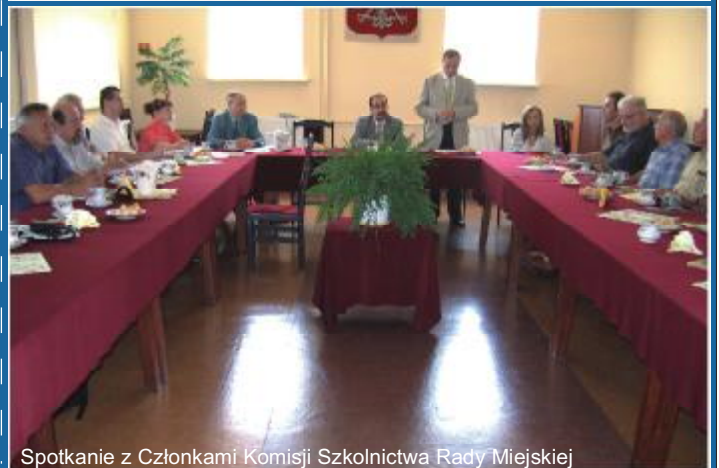
Spotkanie z Członkami Komisji Szkolnictwa Rady Miejskiej