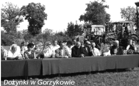
Dożynki w Gorzykowie