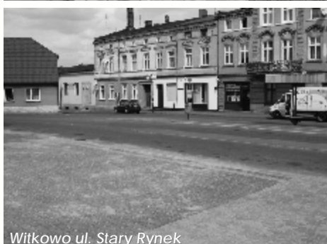
Witkowo ul. Stary Rynek