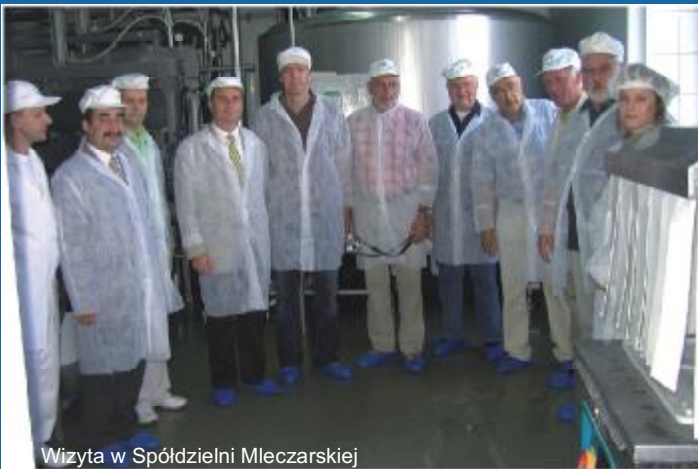
Wizyta w Spółdzielni Mleczarskiej