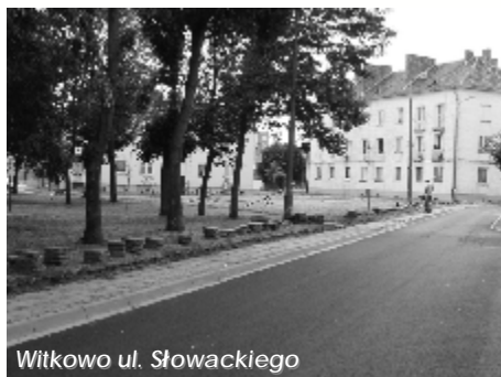
Witkowo ul. Słowackiego

Rynek, Płk. Hynka, Kwiatowej i Słowackiego, - wykonano adaptację pomieszczenia dla Pogotowia Ratunkowego - stacjonującej karetki „W”,