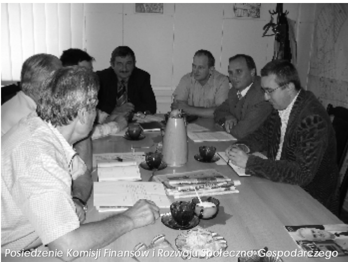
Posiedzenie Komisji Finansów i Rozwoju Społeczno-Gospodarczego

W dniu 15 września odbyło się posiedzenie Komisji Szkolnictwa, Kultury, Sportu i Opieki Społecznej. Komisja zaopiniowała projekty uchwał przygotowane na wrześniową sesję Rady Miejskiej, ponadto zapoznała się z funkcjonowaniem Miejsko-Gminnego Ośrodka Pomocy Społecznej i z dowozami dzieci do szkół. Ważnym punktem posiedzenia było spotkanie z 6-osobową delegacją z zaprzyjaźnionej gminy niemieckiej Am Dobrock.