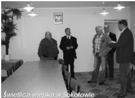
Świetlica wiejska w Sokotowie