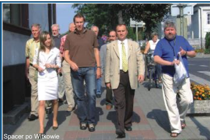
Spacer po Witkowie