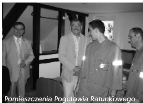
Pomieszczenia Pogotowia Ratunkowego