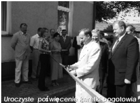
Uroczyste poświęcenie karetki pogotowia