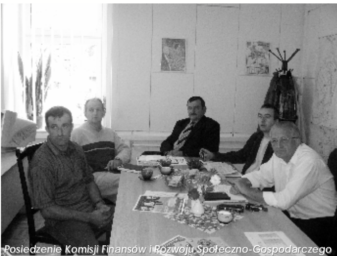
Posiedzenie Komisji Finansów i Rozwoju Społeczno-Gospodarczego