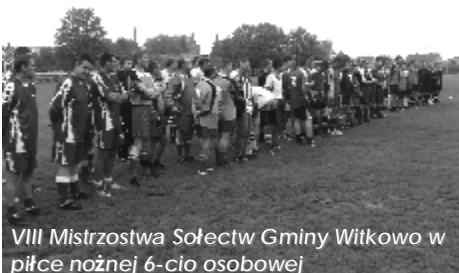
VIII Mistrzostwa Sołectw Gminy Witkowo w piłce nożnej 6-cio osobowej