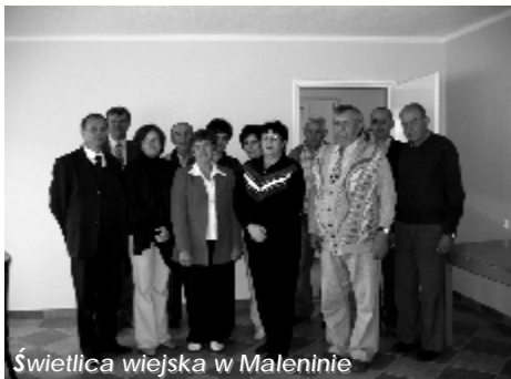
Świetlica wiejska w Maleninie