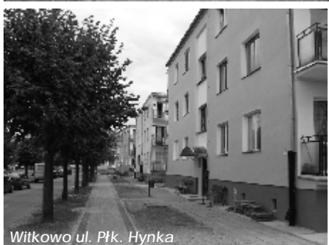
Witkowo ul. Płk. Hynka

Rynek, Płk. Hynka, Kwiatowej i Słowackiego, - wykonano adaptację pomieszczenia dla Pogotowia Ratunkowego - stacjonującej karetki „W”,