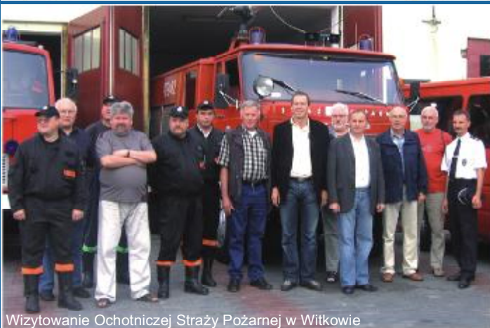
Wizytowanie Ochotniczej Straży Pożarnej w Witkowie