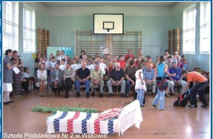
Szkoła Podstawowa Nr 2 w Witkowie