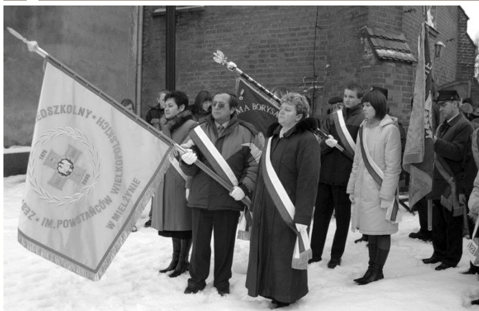
„Tu, gdzie się rodził ojciec i matka, Gdzie Biały Orzeł na sztandarze- Tu wszędzie jest Polska”.