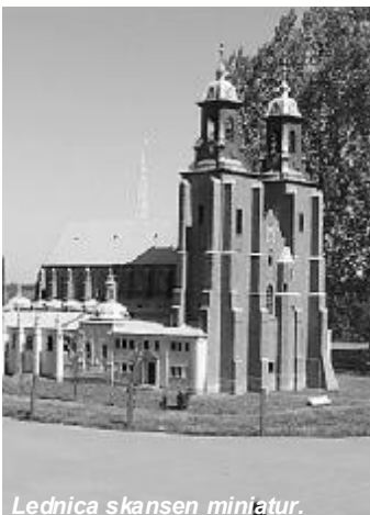
Lednica skansen miniatur.

od poniedziałku do niedzieli nie brakowało im atrakcji, zajęć i wycieczek. Codziennie spotykały się o godz. 9:00 w klubie i do