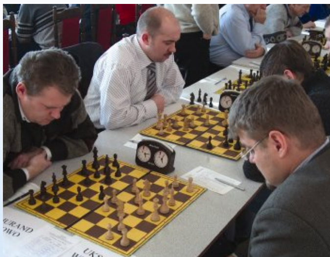
Dopiero drugie miejsce !!!