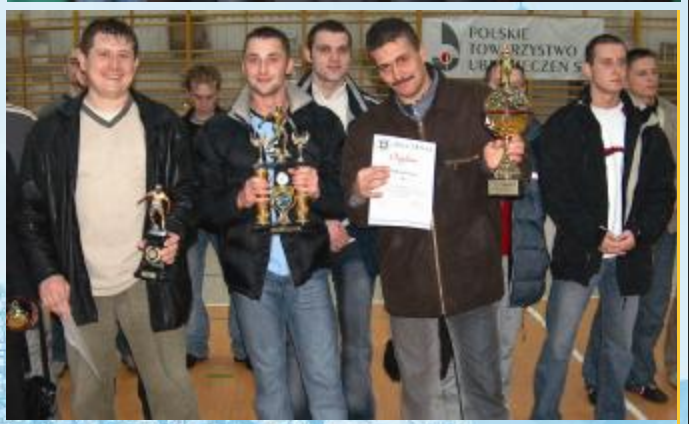
Zwycięzcy Miejskiej Ligi Piłki Halowej - zespół „Hotel Gniezno”