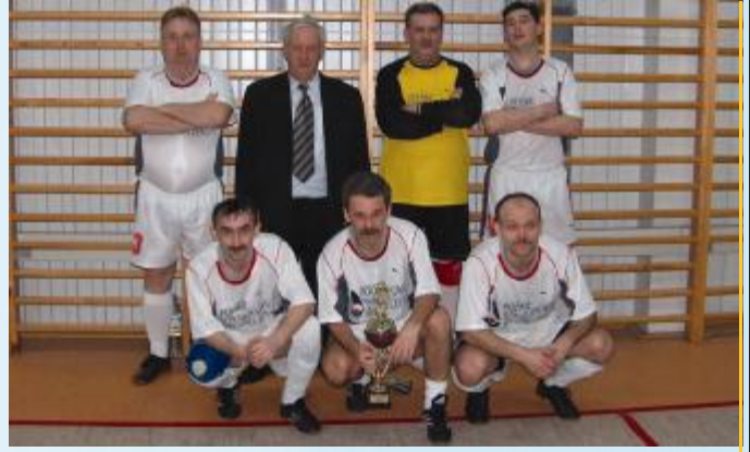
Zwycięzcy Turnieju halowej piłki nożnej Old-Boy zespół „Burchalot”