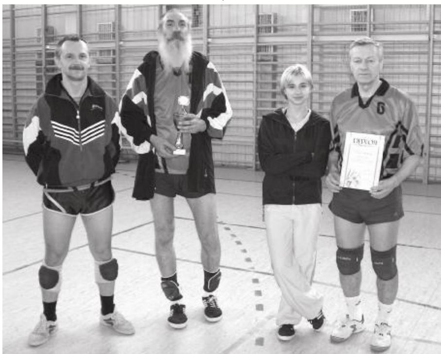
Drużyna zwycięzców OLD-BOY Witkowo