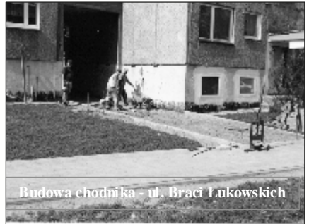
Budowa chodnika - ul. Braci Łukowskich