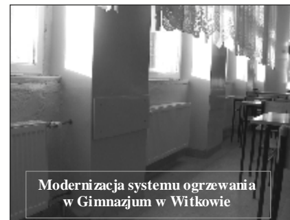
Modernizacja systemu ogrzewania w Gimnazjum w Witkowie

4. Modernizacja systemu ogrzewania budynku Gimnazjum w Witkowie. Wykonawcą zadania była firma EKO-PLUS Centrum Techniki Grzewczej i Sanitarnej z Gniezna. Wartość inwestycji 198.000,00 zł. Prace polegały na wymianie pionów grzewczych i grzejników w całym budynku, tak w części szkolnej, jak i mieszkalnej. Wcześniej wykonana modernizacja kotłowni oraz wykonane w tym roku prace winny wpłynąć w znaczny sposób na wydajność grzewczą, a co za tym idzie na poprawę efektywności grzania w poszczególnych pomieszczeniach wraz z ograniczeniem zużycia opału.