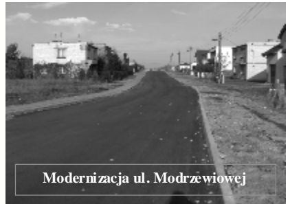
Modernizacja ul. Modrzewiowej

utrudnione, a nowy parking ułatwi parkowanie i wpłynie na poprawę bezpieczeństwa ruchu drogowego.