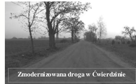
Zmodernizowana droga w Ćwierdzinie

1. Modernizacja nawierzchni dróg gminnych w miejscowościach: Ćwierdzin, Witkówek, Kamionka o łącznej długości ok. 3.385 mb (pow. ok. 12.726 m 2 ). Wykonawcą zadania było Przedsiębiorstwo Robót Drogowych Sp. z o. o. z Gniezna. Koszt inwestycji 587.779,03 zł.. Wykonanie tych prac ułatwiło mieszkańcom korzystanie z dróg na terenie naszej gminy wpływając jednocześnie na poprawę bezpieczeństwa. Utwardzenie dróg skróciło znacznie czas, który potrzebny był na dotarcie do miejscowości Witkowo, celem załatwienia jakichkolwiek spraw, czy to urzędowych, czy chociażby dokonania codziennych zakupów