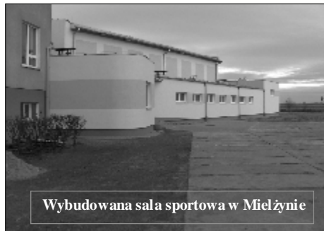
Wybudowana sala sportowa w Mielżynie

8. Budowa sieci wodociągowej wraz z przyłączami w miejscowościach: Chładowo-Kołaczkowo,