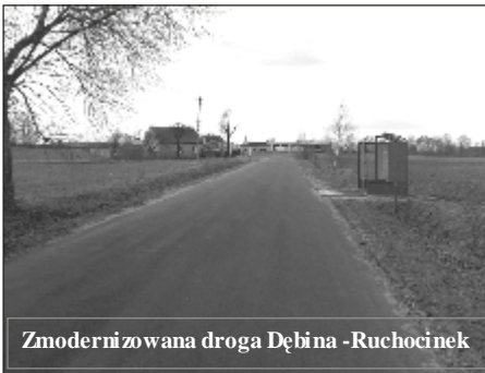
Zmodernizowana droga Dębina - Ruchocinek