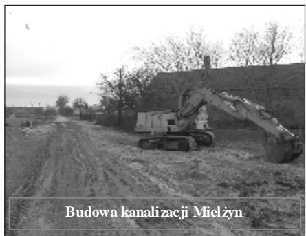
Budowa kanalizacji Mielżyn

2. Modernizacja drogi gminnej Dębina – Ruchocinek. Wykonawcą zadania było Przedsiębiorstwo Robót Drogowych Sp. z o. o. z Gniezna. Wartość wykonanych robót wynosiła 867.002,50 zł. Kwota dofinansowania z Programu SAPARD 380.201,92 zł.. Inwestycja obejmowała modernizację nawierzchni drogi na długości 3.552 mb., wykonanie nowej nawierzchni na tym odcinku drogi spowodowało poprawę bezpieczeństwa oraz ułatwiło w znaczny sposób poruszanie się mieszkańców wsi po drogach gminnych, szczególnie mieszkańcom wsi Ruchocinek i Dębina.