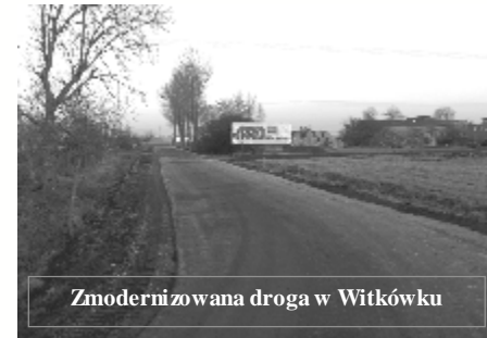
Zmodernizowana droga w Witkoku

obejmuje wykonanie kanalizacji sanitarnej o łącznej długości 14.423 mb, 125 szt. przykanalików o długości 2.189 mb oraz 2 przepompownie ścieków, które będą tłoczyć ścieki do Witkowa. Termin wykonania 30.07.2005r. Inwestycja w trakcie realizacji. W roku 2004 wykonano rurociągi tłoczne z Witkowa do Mielżyna i Jaworowa o łącznej długości ca 9,0 km. Trwa układanie rurociągów kanalizacyjnych w miejscowości Mielżyn, pobudowano jedną pompownię.