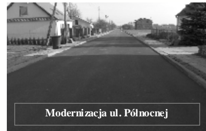
Modernizacja ul. Północnej

3. Modernizacja nawierzchni ulic: Północnej, Plk. Hynka, Modrzewiowej w Witkowie o łącznej długości ok. 1.067 mb (pow. ok. 7.017 m 2 ). Wykonawcą zadania było Przedsiębiorstwo Robót Drogowych Sp. z o. o. z Gniezna. Koszt inwestycji 354.533,71 zł. Wykonanie tych prac ułatwiło mieszkańcom Witkowa korzystanie z ulic na terenie naszego miasta, wpływając jednocześnie na poprawę bezpieczeństwa. Nowe nawierzchnie asfaltowe wpłynęły także na poprawę estetyki miasta.