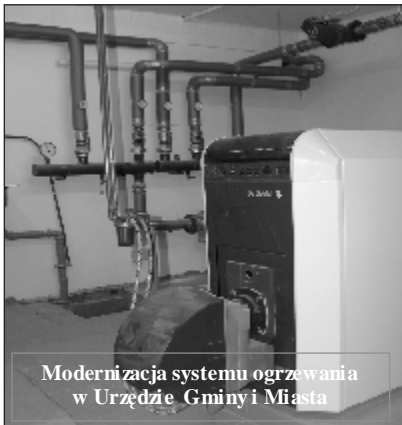
Modernizacja systemu ogrzewania w Urzędzie Gminy i Miasta

wie. Wykonawcą zadania była firma EKO-PLUS Centrum Techniki Grzewczej i Sanitarnej z Gniezna. Wartość inwestycji po przetargu 107.362,49 zł. Prace polegały na zmianie systemu grzewczego z tradycyjnego węglowego na olejowy. W trakcie modernizacji kotłowni wymieniono grzejniki w całym budynku. Wykonanie tego zadania wpłynęło przede wszystkim na likwidację emisji spalin do środowiska i poprawiło efekt grzania w poszczególnych pomieszczeniach budynku Urzędu.