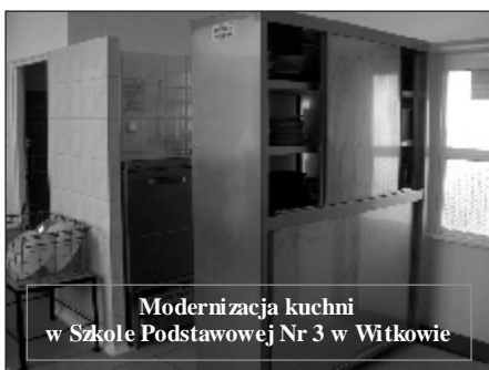
Modernizacja kuchni w Szkole Podstawowej Nr 3 w Witkowie

7. Budowa sali sportowej w Mielżynie. Wyko-