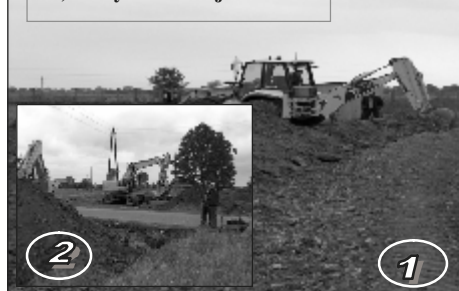
Budowa sieci wodociągowej 1) Chładowo-Kołaczkowo, 2) Gorzykowo-Czajki

9. Budowa chodników na terenie gminy i miasta Witkowo. W 2004r. ułożono nowe nawierzchnie